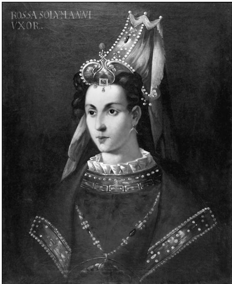
Один из портретов Роксоланы