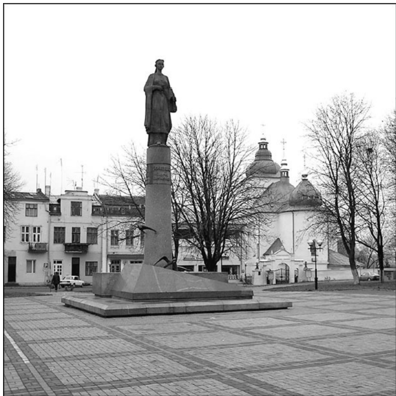
Памятник Роксолане в Рогатине

городков считали, что будущая султанская жена родилась в 1505 году именно в их «пенатах». На звание родного городка Роксоланы-Хюррем претендовали как минимум двое: Чемеривцы и Рогатин. При этом сам городок Чемеривцы появился только в 1565 году.