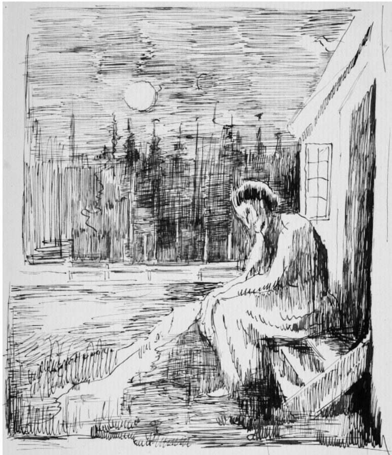
Иллюстрация в дневнике