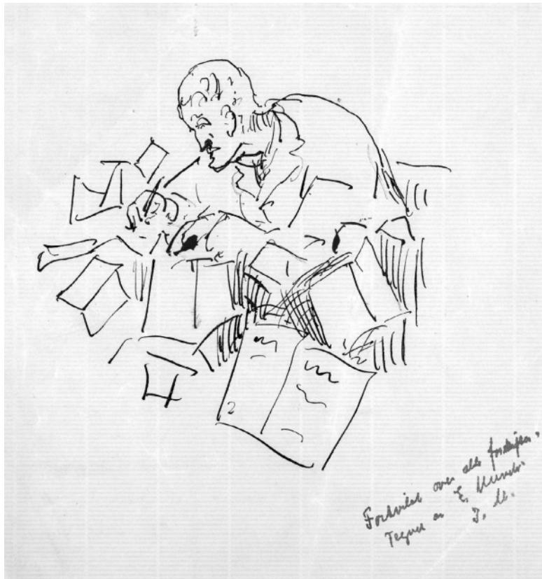
Автопортрет. Рисунок пером. 1930-е гг.