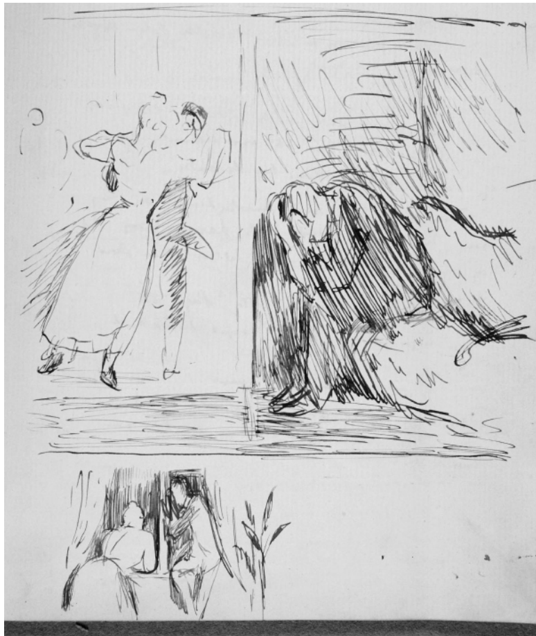
Иллюстрация в дневнике

– Да, красивый вечер. И свет такой мягкий, нет резких