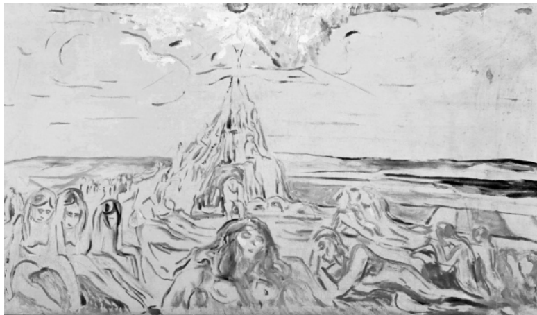
Иллюстрация в дневнике