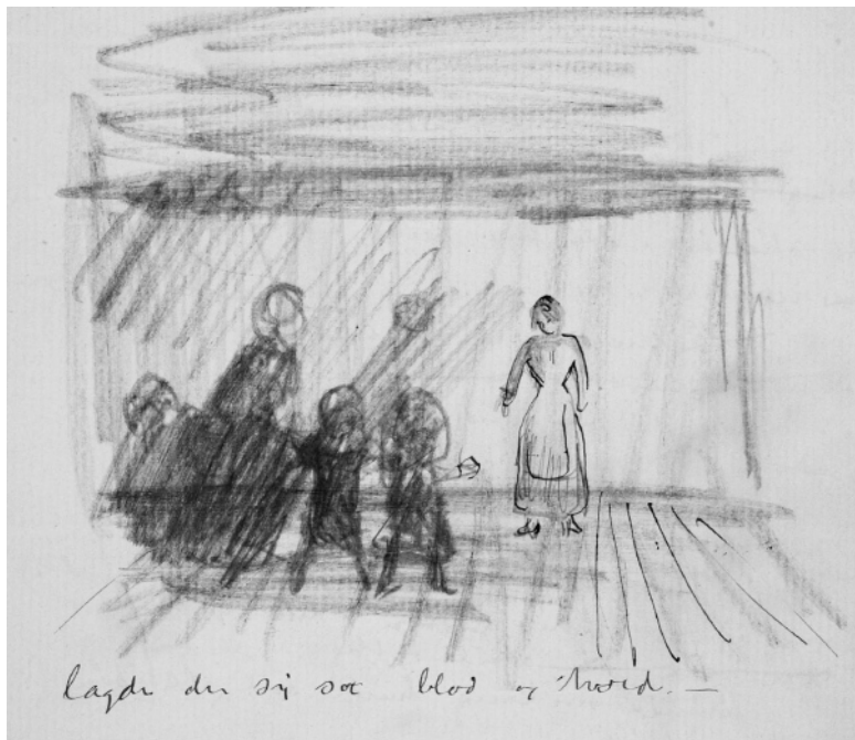
Иллюстрация в дневнике