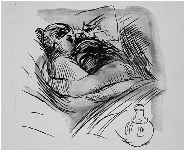
Иллюстрация в дневнике

И люди почувствуют святость и власть этого мгновения и снимут перед ним шляпу, как в церкви.