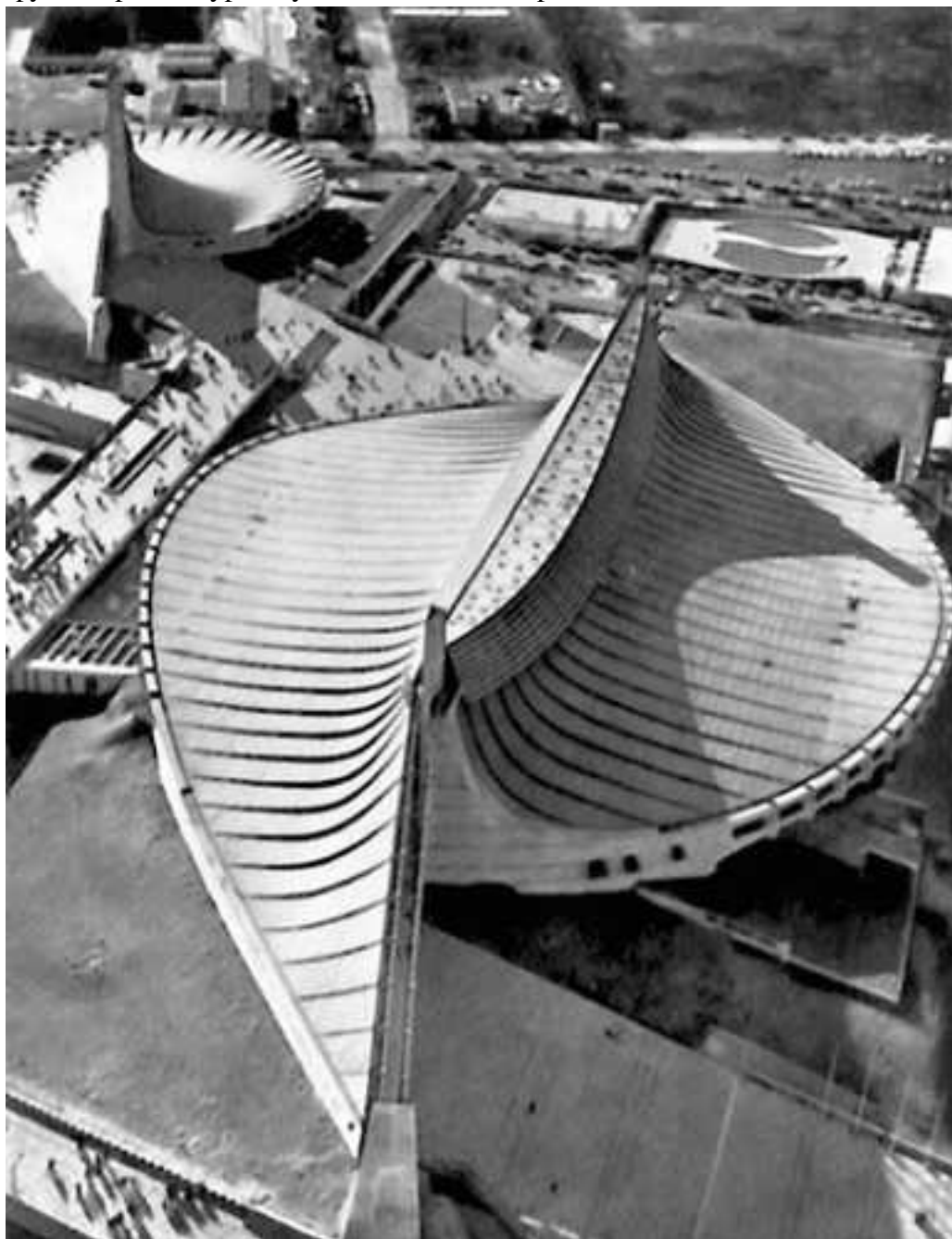
Национальный гимнастический зал Иомоги в Токио. К. Танге. 1964 год

Следует заметить, что творения Гауди поразили Оскара Нимейера не только и, пожалуй, не столько свободой линий. Долгое время искавшего новые методы в архитектуре Нимейера привлекали в творчестве провинциального мастера прежде всего его самобытность, близость к природе, эмоциональное наполнение и глубокая содержательность. Той же цели добивался в своем творчестве и сам Нимейер, однако происходило это в несколько ином измерении – в рамках другого архитектурно-художественного направления.