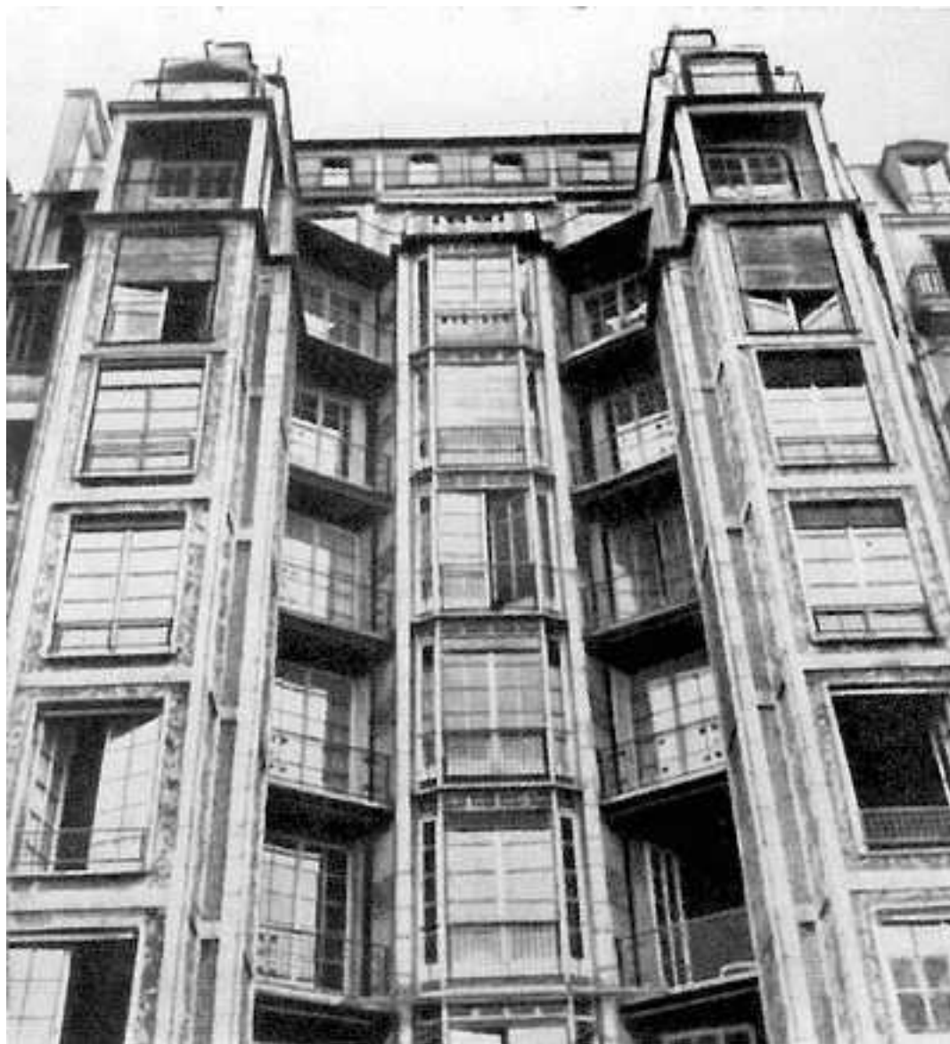
Дом на улице Франклина в Париже. О. Перре. 1903 год

Действительно, невозможно не согласиться с тем, что творчество Гауди возникло несколько преждевременно. На самом деле, казалось, зодчество, равно как и искусство в целом, развивалось как бы по прямой линии, согласно законам логики.