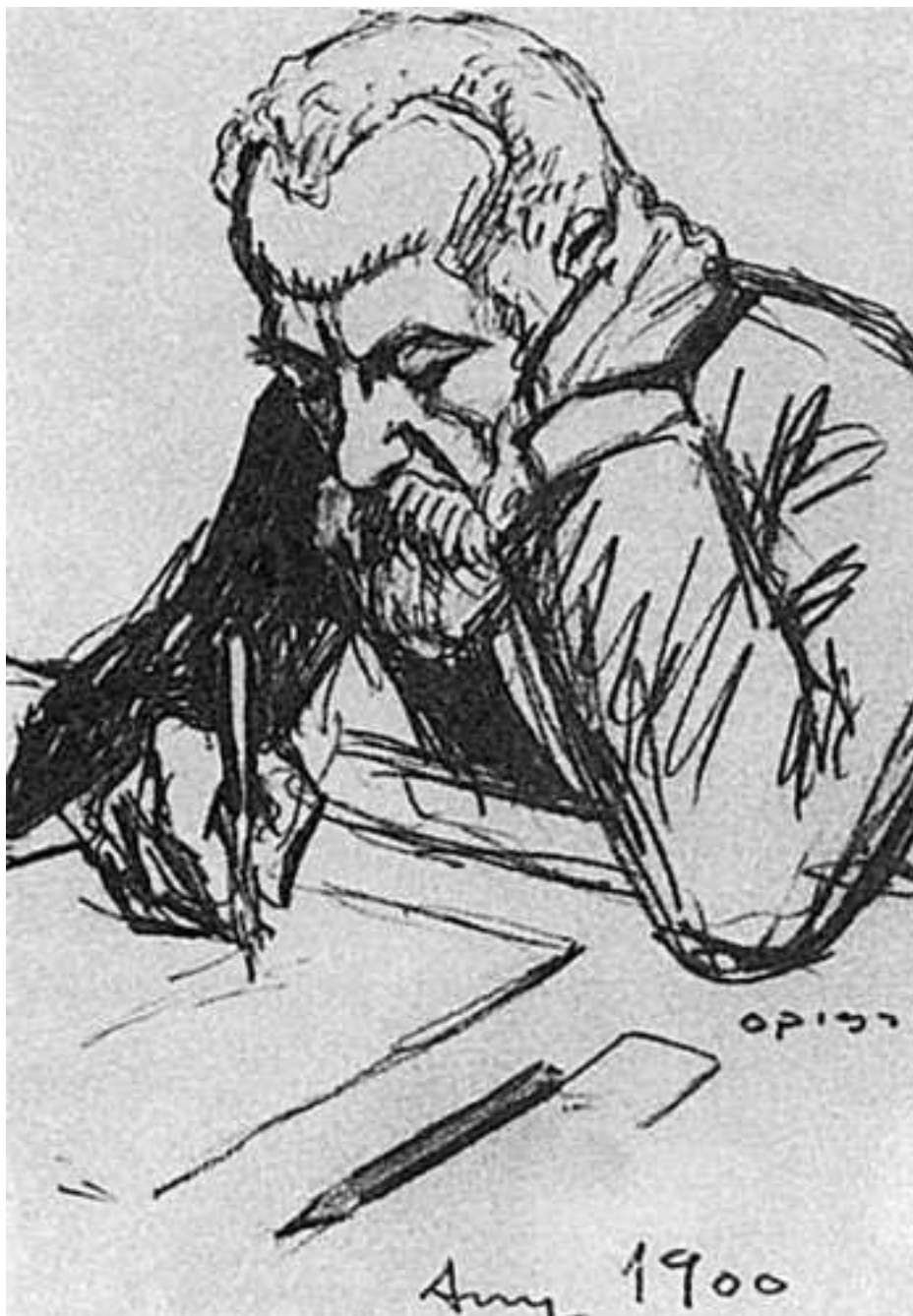
Портрет Антонио Гауди работы Рикардо Ойедо. 1900 год

Гауди создавал свои творения на протяжении почти 48 лет. Несмотря на столь большой для любого мастера срок, жизнь и творчество этого архитектора до сих пор остаются величайшей загадкой не только для любителей архитектурного искусства, но также и для профессиональных знатоков. Мистикой и тайной покрыты дни жизни зодчего, его творения и этапы их создания.