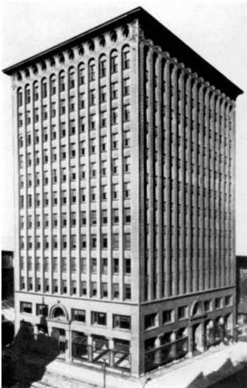
Гаранти-билдинг, Буффало, США. Луис Генри Салливан. 1894–1895 годы

Однако Антонио Гауди прославился именно грандиозными сооружениями. Его профессионализм невозможно было не заметить. Все созданные им произведения размещены в центральном районе Барселоны. И все они занимают центральные участки в отведенном районе, имеют огромные размеры и полифункциональны (в этой связи будет достаточно упомянуть колонию Гуэль, представляющую собой сложный архитектурный комплекс).