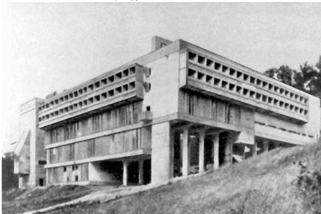
Монастырь Ля Туретт. Ле Корбюзье. 1957–1959 годы

Творчество Оскара Нимейера можно считать своеобразным выражением искусства трех наций: европейской, южноамериканской и африканской. Возможно, именно поэтому знаменитый архитектор смог ощутить обособленность творчества Антонио Гауди не только в мировой, но и в национальной, испанской, культуре.