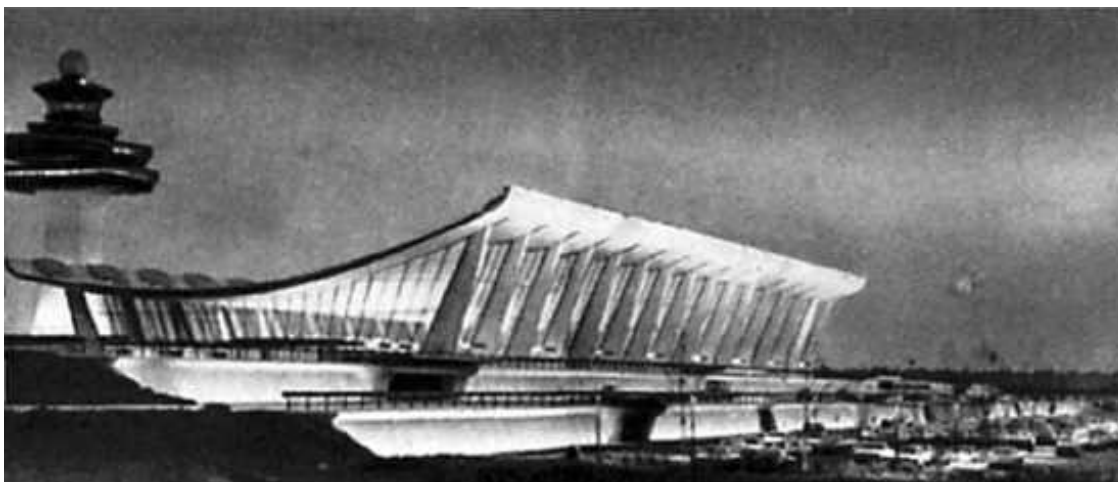
Здание аэровокзала в Вашингтоне. Э. Сааринен. 1962 год

Однако далее, за прославляющей мастерство архитектора тирадой, следует критика его творческой манеры. Словно бы опомнившись и в то же время вступая в противоречие с самим собой, Рагон замечает: «Гауди мало что изобрел. В истории современной архитектуры Гауди не принадлежит место новатора. Он не продвинул архитектуру ни на один шаг...»