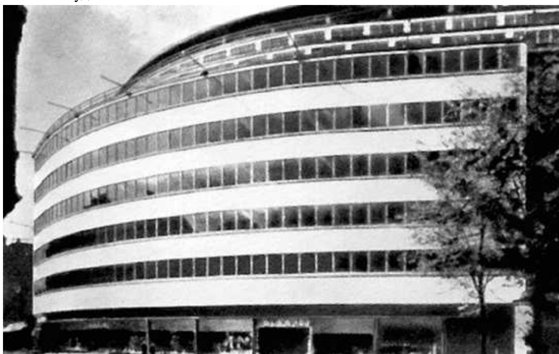
Магазин Шокена в Хемнице (Карл-Маркс-Штадт). Э. Мендельсон. 1928 год

Умами большинства мастеров середины XX века владели идеи, ставшие основой современного движения. Казалось, искусству модернизма уже ничто не угрожает, его будущее виделось многим ясным и безоблачным. Действительно, модернизм смог занять в искусстве привилегированное положение. Именно поэтому незамеченными в то время оставались произведения, созданные такими талантливыми мастерами-архитекторами, работавшими в начале XX века, как О. Перре, М. Пьячентини, Э. Мендельсон, Р. Эстеберг, Э. Сааринен и, конечно же, Антонио Гауди.