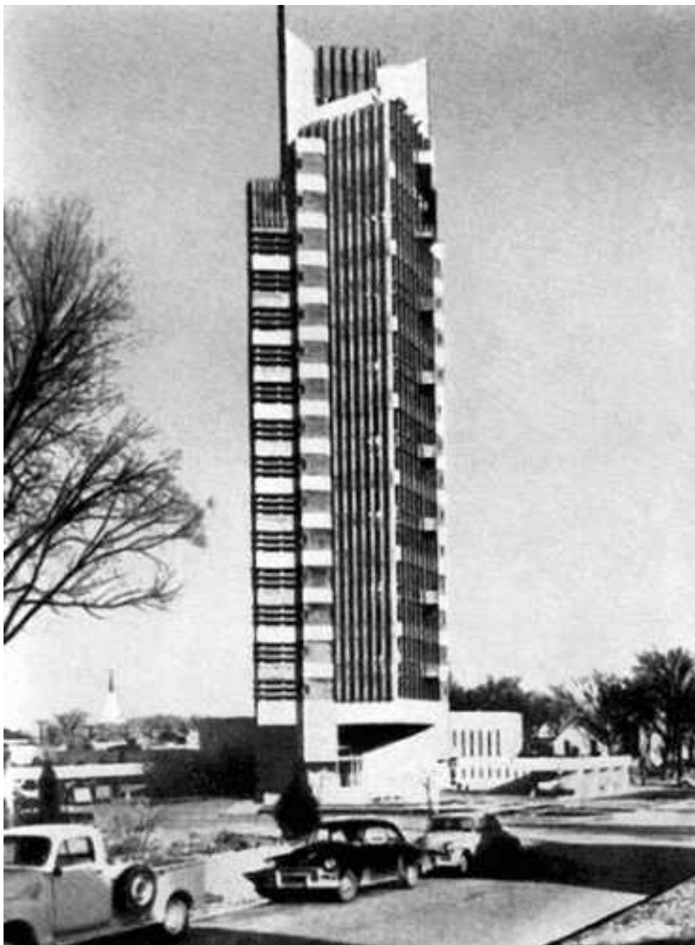
Жилое и административное здание Башня Прайса, Бартлесвилль, США. Фрэнк Ллойд Райт. 1955 год

Творчество Антонио Гауди складывается словно бы из синтеза, с одной стороны, его духовных устремлений, уводящих в прошлое, возвращенных на религиозности, и, с другой стороны, его фантазий, выходящих за рамки реальной действительности. Гауди был и остается одним из крупнейших и талантливейших мастеров архитектурного искусства рубежа XIX–XX столетий, когда в мировой культуре стало оформляться новое, современное искусство.