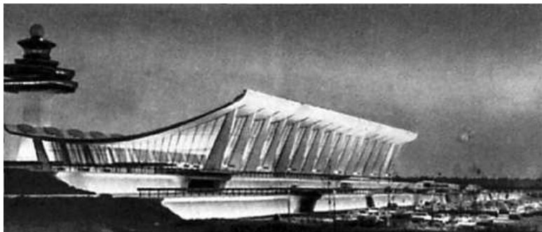
Здание аэровокзала в Вашингтоне. Э. Сааринен. 1962 год

других течений отличались противоречивостью. Так, Мишель Рагон, знаменитый автор книги «О современной архитектуре», вышедшей в начале 60-х годов XX века, с величайшим восхищением говорит о Гауди: «Гауди – поэт камня... Гауди превосходит всех „одержимых творцов“ силой своего дарования...» Столь же лестно автор отзывается и о произведениях, созданных известным зодчим.