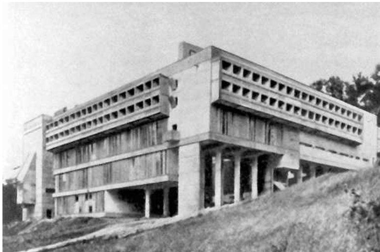
Монастырь Ла Туретт. Ле Корбюзье. 1957–1959 годы

Необходимо заметить, что искусство Испании имеет особенное значение в истории развития европейской культуры. Еще в XIX веке впервые прозвучали слова о том, что Африка начинается за Пиренеями. Но с данным утверждением можно было бы поспорить.