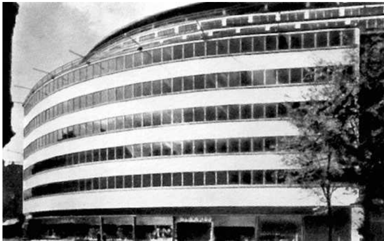
Магазин Шокена в Хемнице (Карл-Маркс-Штадт). Э. Мендельсон. 1928 год

Словно в стороне от общего развития искусства начала XX столетия оставались даже целые художественные направления. Среди них необходимо особенно отметить следующие: экспрессионизм, органичная архитектура и неоклассицизм. Последователи указанных течений неизменно объявлялись сторонниками модернизма бесталанными неудачниками, не сумевшими доказать жизнеспособность проповедуемых ими принципов художественного видения. Все то, что не отвечало требованиям современного искусства, не имело права на жизнь и не могло быть признано ценным.