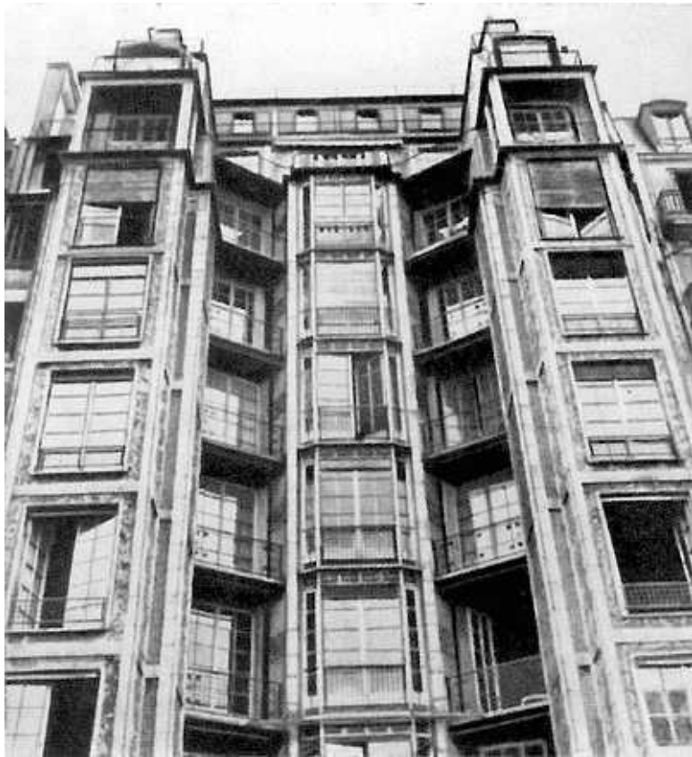
Дом на улице Франклина в Париже. О. Перре. 1903 год

Действительно, невозможно не согласиться с тем, что творчество Гауди возникло несколько преждевременно. На самом деле, казалось, зодчество, равно как и искусство в це-