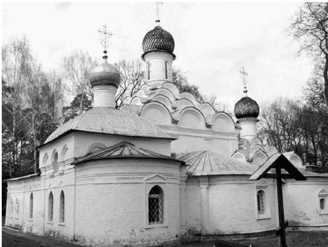
С южной стороны Михаила Архангела находится маленькое кладбище

Вначале единственный вход в храм Михаила Архангела находился с северной стороны, там, куда подходила дорога из села. Позже здание было перестроено по канонам классицизма и, к сожалению, утратило свою оригинальную композицию. Позднейшие строители, не искусные в архитектурном искусстве, неловко расширили окна, переложили полы, снесли тесовую кровлю, заменив ее железной. Под банальной четырехскатной крышей спрятали очаровательные кокошники – за ними якобы некому было ухаживать. Тогда же снесли маленькую звонницу над западной стеной, а вместо нее возвели колокольню, сначала деревянную, а потом каменную, трехъярусную, с часами и шпилем.