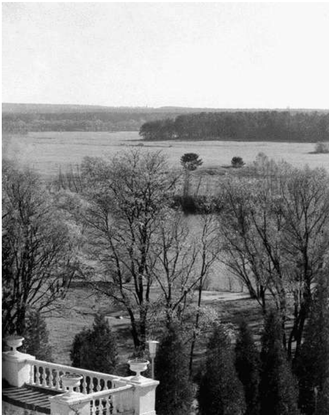
Все дороги Архангельского ведут к Москве-реке

Нынешнее Архангельское завершается там, где некогда начиналось – на обрывистом берегу Москвы-реки. Отсюда взгляду открываются заречные дали, только отсюда создается полное впечатление об ансамбле и только здесь можно осознать его колоссальный размер. Некогда с этого места княжескую усадьбу писали крепостные художники, пытаясь охватить взглядом все сразу: дворец, парк и маленькую старую церковь – единственную постройку, уцелевшую с тех времен, когда будущий дворцовый комплекс был всего лишь хозяйственной вотчиной.