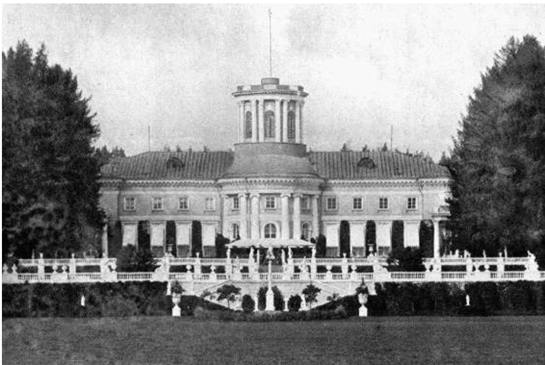
Большой дом. Фотография, конец XIX века

Вместе с Большим домом на высоком берегу Москвы-реки строились 2 тепличных павильона, законченные к 1786 году. Ни один из них до нашего времени не сохранился, однако представить, как они выглядели, позволяет рисунок крепостного художника, где оранжереи изображены вместе с ближайшим участком Большого партера, как ландшафтным искусстве называют парадную, открытую часть парка, для которой характерны геометрическое построение, строгость линий и форм. При оформлении партера в Архангельском Тромбаре не понадобилась фантазия, ведь подобные сооружения не допускали отклонения от правил: прямые аллеи, огромные засеянные травой площади, редко посаженные и подстриженные по-версальски в виде шаров деревья. Позади них возвышалась стена из старых лип с пышными кронами. Считается, что липы остались от французского сада Дмитрия Михайловича, поскольку новый хозяин хотел иметь настоящий парк сразу, не дожидаясь пока вырастут молодые деревца.