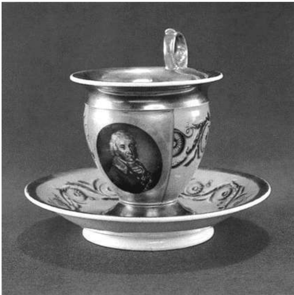
Чайная пара с портретом Николая Алексеевича Голицына. Фарфор из фондов музея-усадьбы «Архангельское»

Думал ли Николай Алексеевич, видевший Париж (а кроме него, Страсбург, Вена, Милан, Турин), о французских королях или нет, но планы его потрясли размахом. Он задумал величественный ансамбль, начав с того, что раскрыл свой дорожный журнал и записал деньги, израсходованные 3 сентября 1780 года, «на букет, извозчика, карточный долг, план Архангельского», за который архитектор де Герн получил 1200 рублей. Тот проект вместе с датой и подписями обеих сторон в полной сохранности дошел до наших дней, в отличие от сведений об авторе. О нем не известно почти ничего, кроме того, что он был немолодым французом и хорошим специалистом с дипломом и премией парижской Школы изящных искусств. Скорее всего, он не приезжал в Россию, и его вклад в Архангельское ограничился планом дворца, или Большого дома, как называл свою новую резиденцию Голицын. Проект парка и всего, что к нему относилось, принадлежал итальянцу Джакомо Тромбара. Он жил в России постоянно и, помимо звания члена Академии художеств и должности придворного зодчего, имел много знакомых среди столичной знати, в числе которых был и Николай Алексеевич. Именно Тромбара предложил разбить в усадьбе парк с террасами и новыми оранжереями, воплотив замысел с итальянским мастерством и русским размахом. Благодаря ему корявый склон превратился