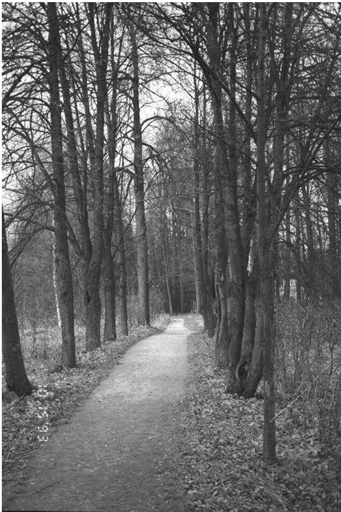
Ни один из путей в Архангельское не минует леса