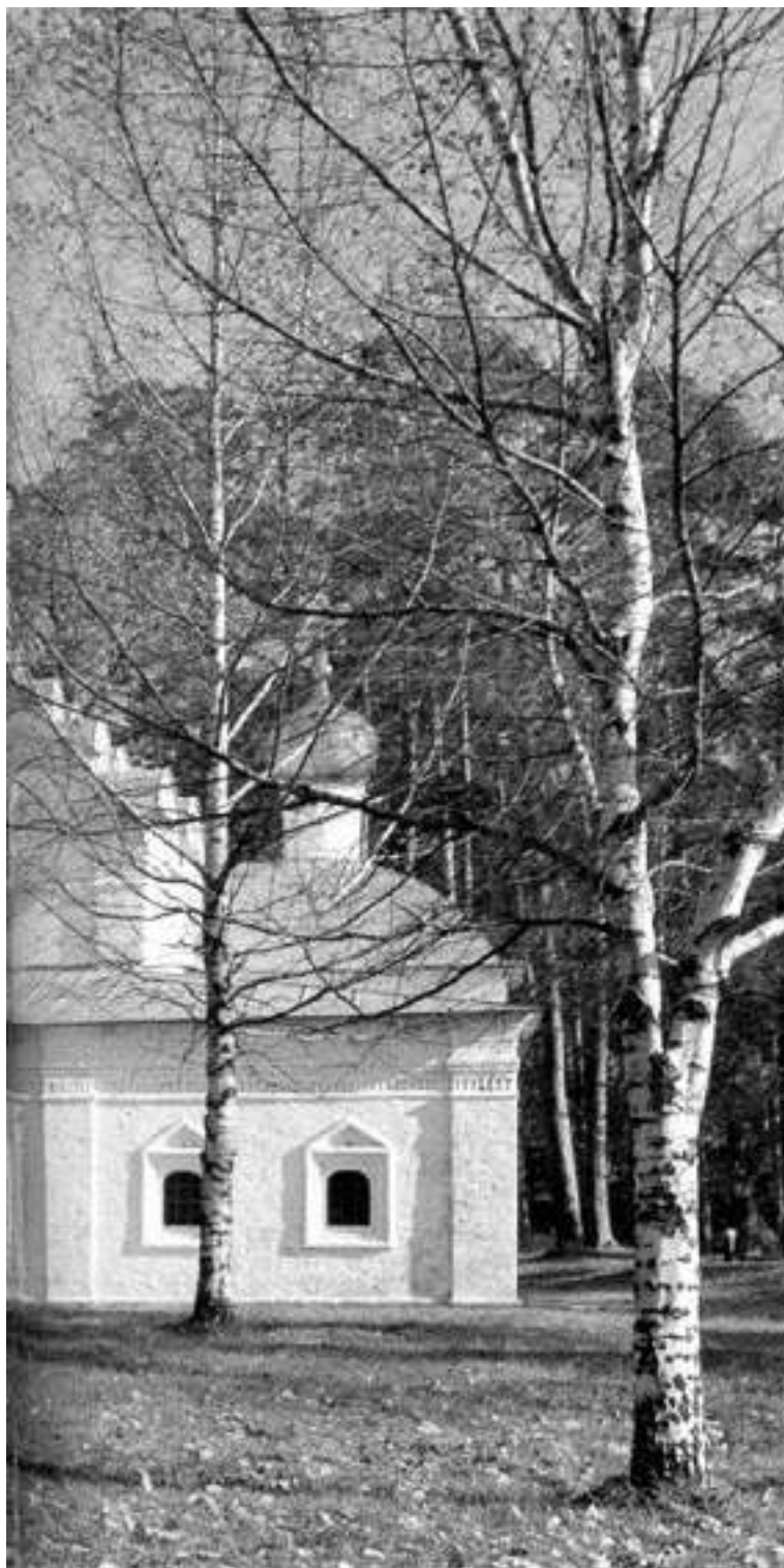
Архангельская церковь прячется за деревьями, словно стыдясь своего скромного вида