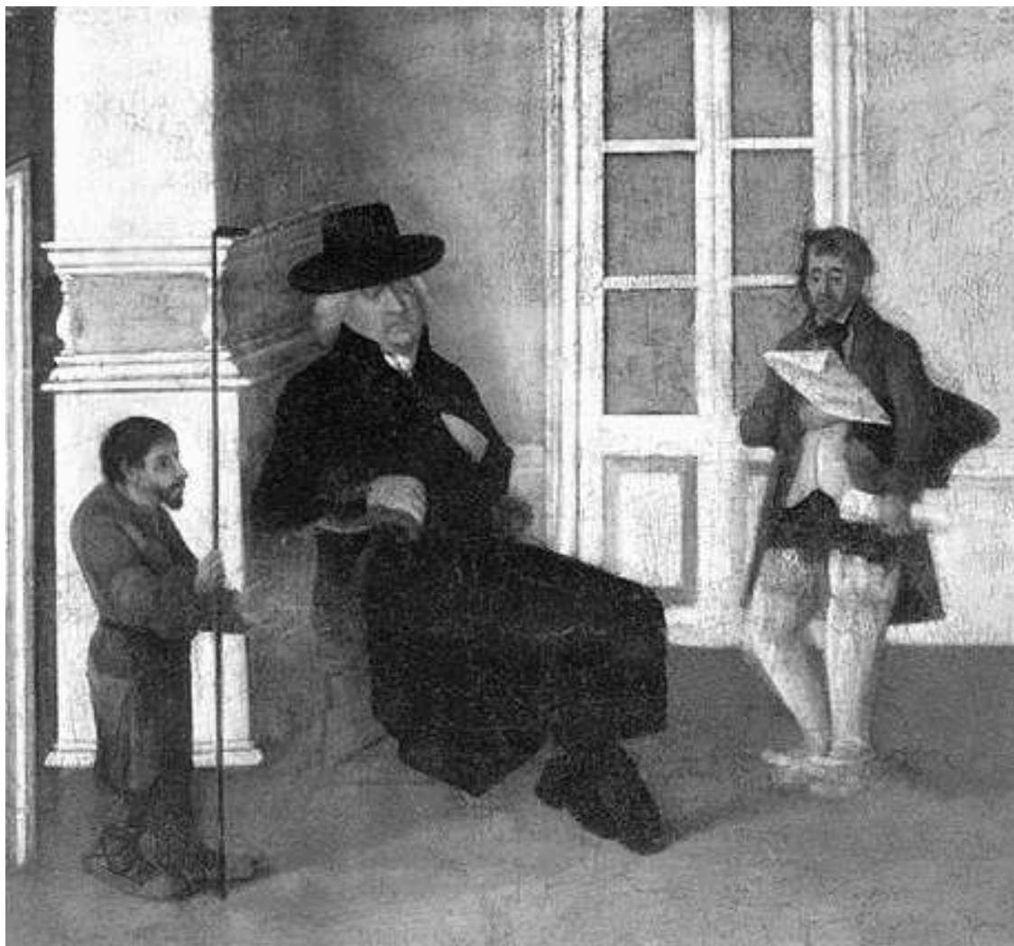
Доклад управляющего своему помещику. Картина неизвестного художника

Дмитрий Михайлович начал придворную карьеру комнатным стольником малолетнего Петра. Став царем, тот отблагодарил верного слугу чином капитана Преображенского полка и, невзирая на его семейное положение, отправил за границу «для науки воинских дел». Голицына больше интересовали дела морские, в частности навигация, которую он изучал в Италии, затем применив знания в Константинополе, где сумел добиться свободного плавания для русских судов по Чёрному морю. После дипломатической миссии в Польше и Саксонии князь управлял Белгородским разрядом (созданная в 1658 году военно-административная единица), причем в официальных бумагах его «писали» сначала воеводой, а затем губернатором. Перебравшись в Москву в качестве сенатора и президента Камер-коллегии, Голицын занимался подготовкой доклада по государственным доходам и расходам. Современники характеризовали его как человека честного, управителя неподкупного, вникавшего в каждую мелочь. Между тем, преклоняясь перед Петром, будучи верным служакой и «разумнейшим человеком своего века», Дмитрий Михайлович отвергал крутую ломку старинного уклада и, к несчастью своему, открыто сочувствовал царевичу Алексею. Обвиненный в заговоре, князь лишился чинов, а потом, уплатив немалый штраф, надолго оказался под домашним арестом.