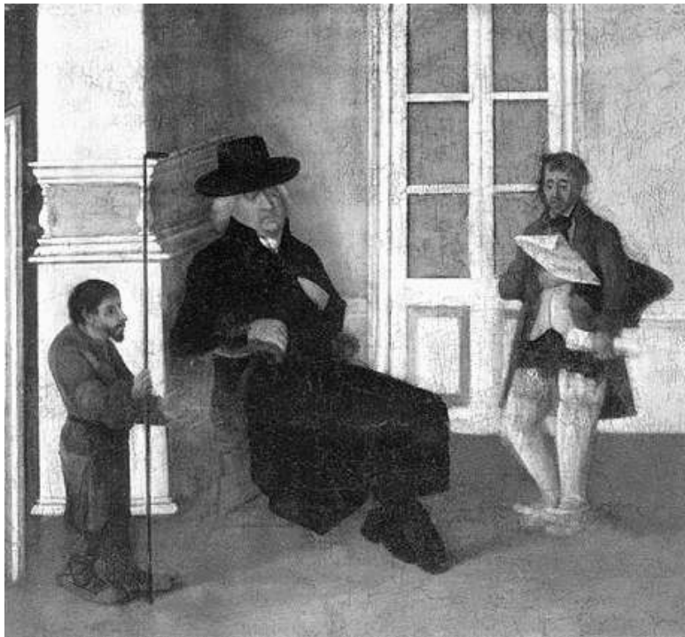
Доклад управляющего своему помещику. Картина неизвестного художника

Дмитрий Михайлович начал придворную карьеру комнатным стольником малолетнего Петра. Став царем, тот отблагодарил верного слугу чином капитана Преображенского полка и, невзирая на его семейное положение, отправил за границу «для науки воинских дел». Голицына больше ин-