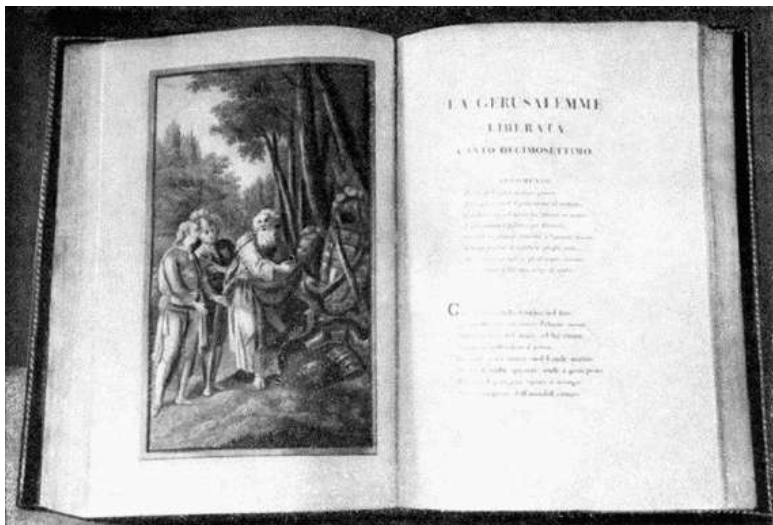
Т. Тассо. Освобожденный Иерусалим. Книга из библиотеки Архангельского

Многие голицынские книги ценились не столько из-за содержания, сколько из-за своей старины и великолепного оформления. Среди них имелись издания, вышедшие в знаменитых типографиях Дидо (Франция), Эльзевиров (Голландия), Баскервиля (Англия), Альда Мануция и Бодони (Италия). К последней также относилось сочинение Торквато Тассо «Освобожденный Иерусалим» с прекрасными иллюстрациями в полный лист. Уникальными изданиями уже в то время считались французский часослов XV века и Библия Мартина Лютера, выпущенная печатниками Виттенберга в