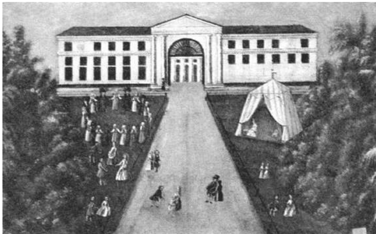
Въездная арка и придворцовые флигели. Рисунок неизвестного художника, XIX век

Уничтожив почти все старые постройки, архитектор принялся за новый дом. Одновременно со стенами дворца поднимались стены флигелей, заставляя мастеров с особым усердием тесать белокаменные блоки. Две двойные колоннады тосканского ордера мало-помалу окружили парадный двор, подчеркнув особую роль дворца в общей композиции ансамбля. Более приземленное их значение состояло в том, что стройные белокаменные колонны образовали удобные – сквозные, но крытые – проходы, связавшие дворец со служебными постройками. Считается, что классическая колоннада в Архангельском появилась немного раньше, чем в дру-