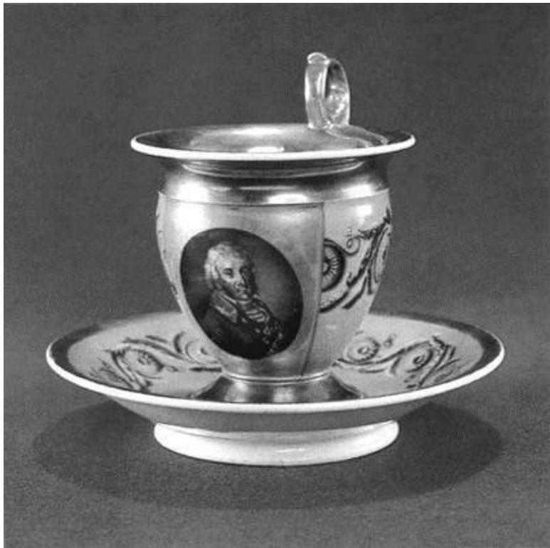
Чайная пара с портретом Николая Алексеевича Голицына. Фарфор из фондов музея-усадьбы «Архангельское»

Думал ли Николай Алексеевич, видевший Париж (а кроме него, Страсбург, Вену, Милан, Турин), о французских королях или нет, но планы его потрясли размахом. Он задумал величественный ансамбль, начав с того, что раскрыл