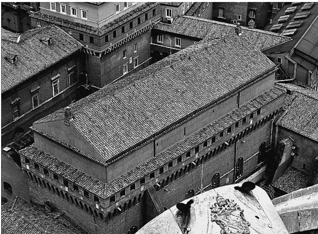
Вид на Сикстинскую капеллу сверху

избран не только кардинал или священник, но и мирянин. Участникам конклава категорически запрещается давать какие-либо обещания, возлагать на себя обязательства, заключать союзы или сделки с целью оказания поддержки определенной кандидатуре. Подобные сделки считаются незаконными.