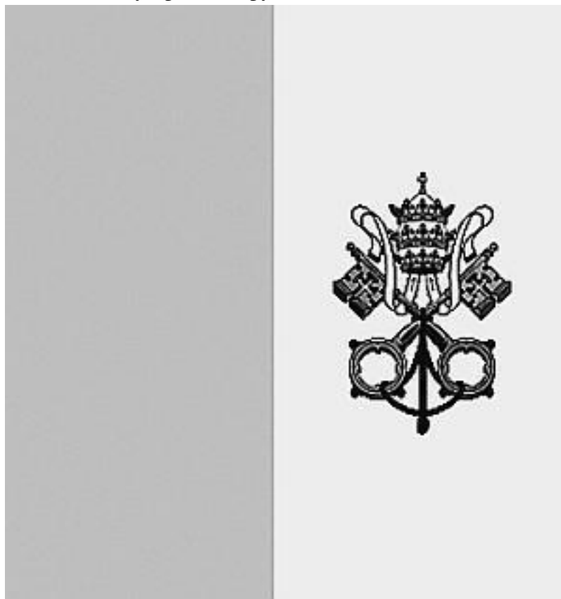
Флаг государства Ватикан

Ватикан сегодня – самое маленькое государство мира, вернее, священный город-государство. Его площадь составляет 0,44 км 2 , а число подданных – около 1000 человек. Любопытно, что это единственное ныне государство, окруженное сплошной каменной стеной.