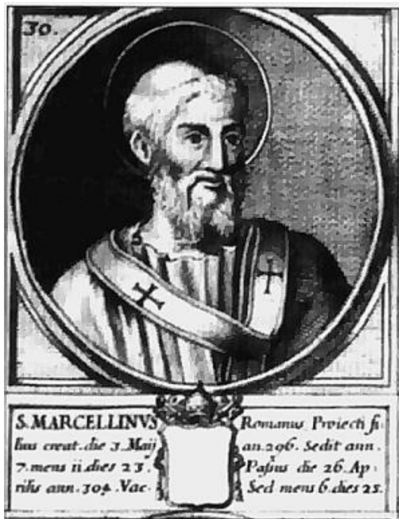
Епископ Марцеллин, первый папа римский

Основывая свои государственные права на преемстве власти от апостола Петра, римские епископы и владения свои называли наследием Петра ( Patrimonium Petri ).