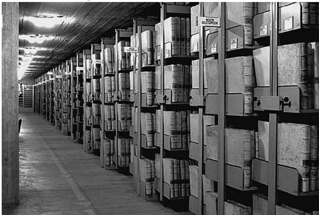
Секретный архив – святая святых папства

Каковы же причины такой таинственности? Вероятно, подобным образом Церковь пытается скрыть от верующих прозаические, земные стороны жизни своего главы. Ведь папа считается непогрешимым, ему якобы не свойственны обычные для простых смертных чувства и страсти, а единственной его заботой является помощь страждущим. Однако многие первосвященники были отнюдь не праведниками.