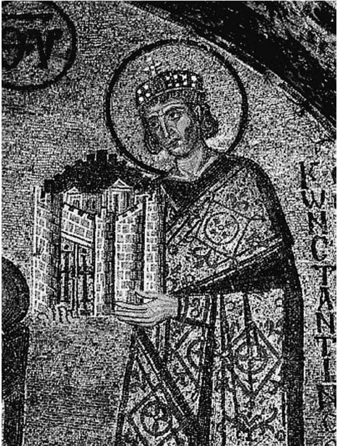
Император Константин Великий. Фрагмент мозаики. Собор Святой Софии в Константинополе. Конец X в.

С IV в. дошли до нас сведения о том, что основателем римской общины был не кто иной, как апостол Петр. А по представлениям того времени он мог выступать только в роли ее епископа. Неизвестно, является ли это утверждение легендой или было извлечено со страниц Священного Писания, тем не менее в его пользу свидетельствуют многие хроники. Например, в Александрийской хронике сохранилась запись следующего содержания: «В первый год царствования Веспасиана умер апостол и иерусалимский патриарх Якобус, которого Петр при отъезде назначил вместо себя епископом Иерусалима».