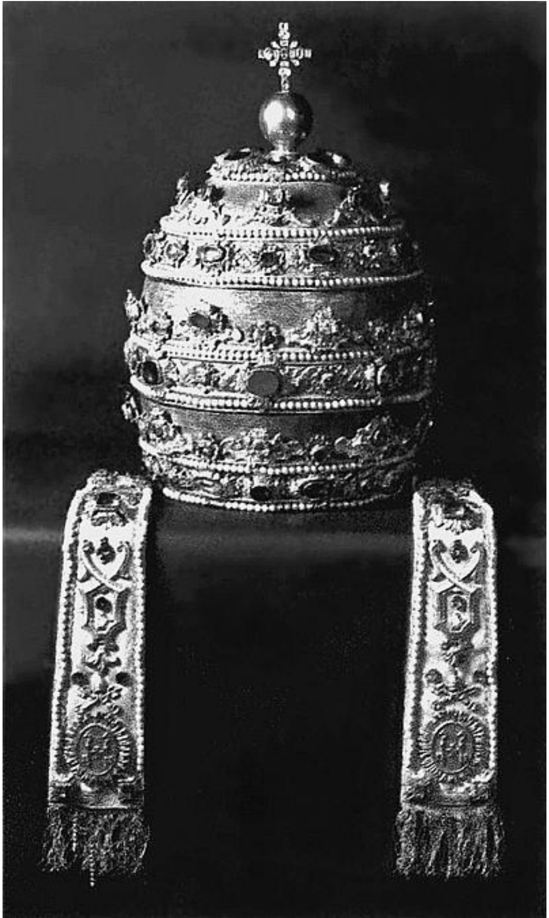
Тиара папы римского