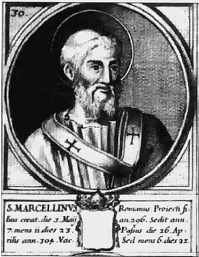
Епископ Марцеллин, первый папа римский