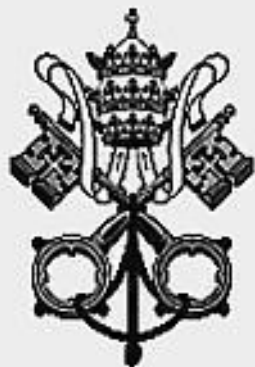
Флаг государства Ватикан