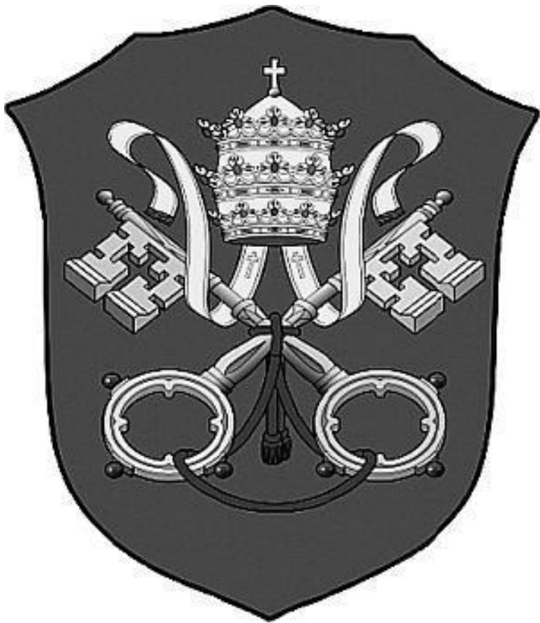
Герб государства Ватикан

Официальная юридическая история Ватикана как полноправной монархии невелика: как государство он существует