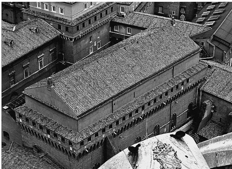
Вид на Сикстинскую капеллу сверху

ется давать какие-либо обещания, возлагать на себя обязательства, заключать союзы или сделки с целью оказания поддержки определенной кандидатуре. Подобные сделки считаются незаконными.