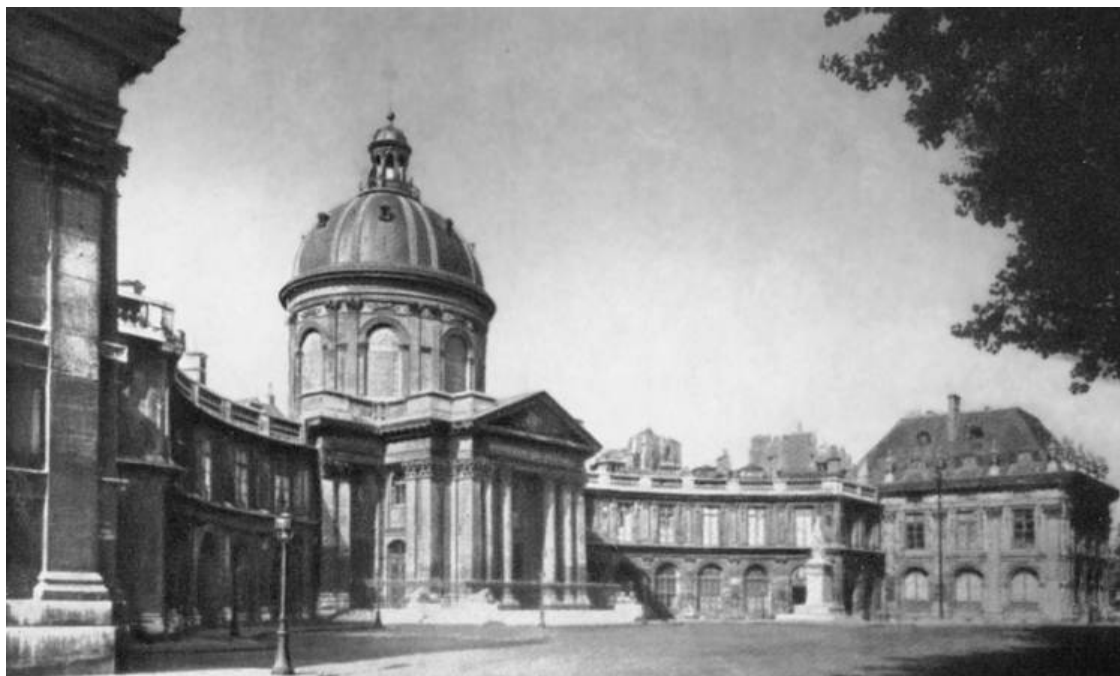
Л. Лево. Коллеж четырех наций

Путешествия монархов по королевству в зените славы не способствуют развитию кругозора. Познавательная цель здесь начисто отсутствует. Его Величество может лишь любоваться тем искусственным миром, который ему добросовестно представляют: чистенькие образчики ремесел и представителей социальных классов, города, которые способны польстить его самолюбию, и наиболее богатые кварталы городов. Как образец такого очковтирательства можно рассматривать путешествие Екатерины Великой в Таврию. По пути следования царицы Потемкин сооружал новенькие чистые деревни, где обитали сытые крестьяне. Они и приветствовали Екатерину, выражая радость и верноподданные чувства. Почти немедленно этот поселок демонтировался, но через некоторое время Екатерину снова встречала та же бригада мужиков, похожих на предыдущих как близнецы, все на тех же деревенских улицах, чистеньких и процветающих.