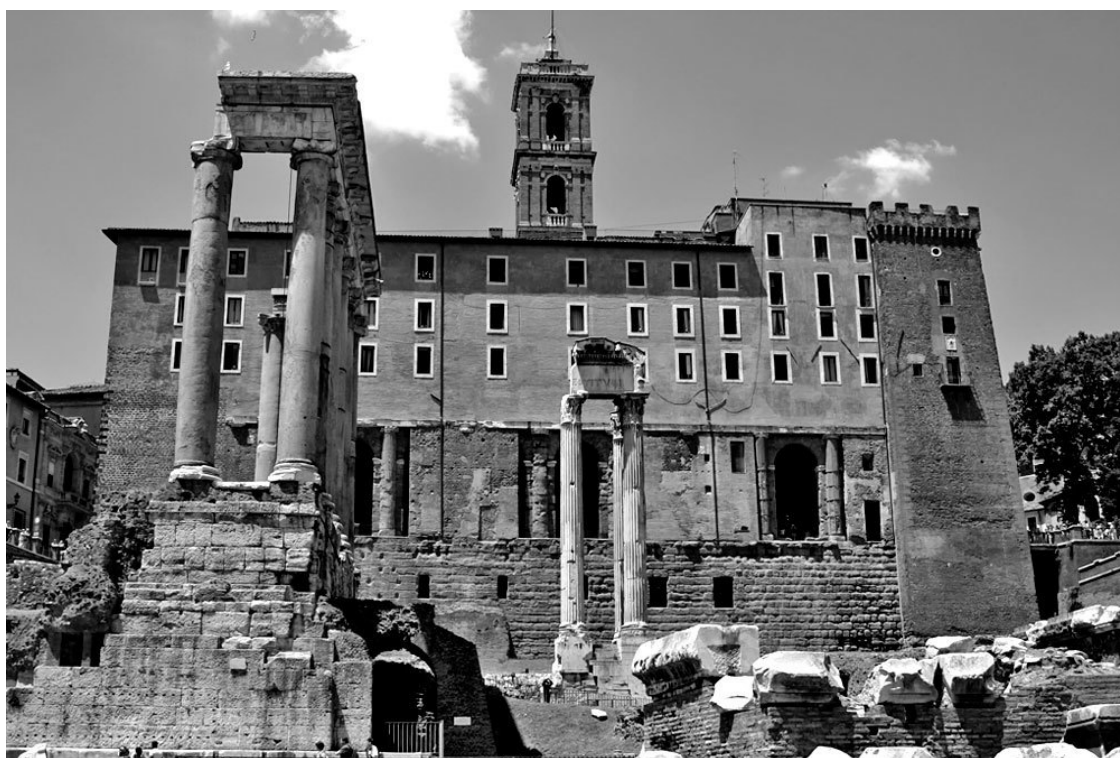
Табуларий – Дворец сенаторов

Великий архитектор XV в. Микеланджело Буонарроти (1475–1564) возвел Дворец сенаторов непосредственно на остовах Табулария. Это помогло уберечь от полного исчезновения главное хранилище документов и императорской казны.