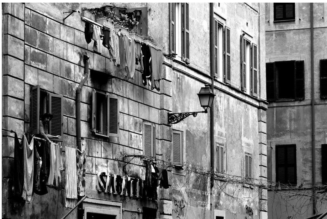
Типичный уголок района Трастевере

На западном берегу реки разместился город-государство Ватикан. Уникальность Рима заключена в его двойной роли – это центр Италии и Римско-католической церкви. Высшее католическое духовенство до недавнего времени не покидало территории Ватикана, за исключением благотворительных посещений тюрем, церквей и больниц.