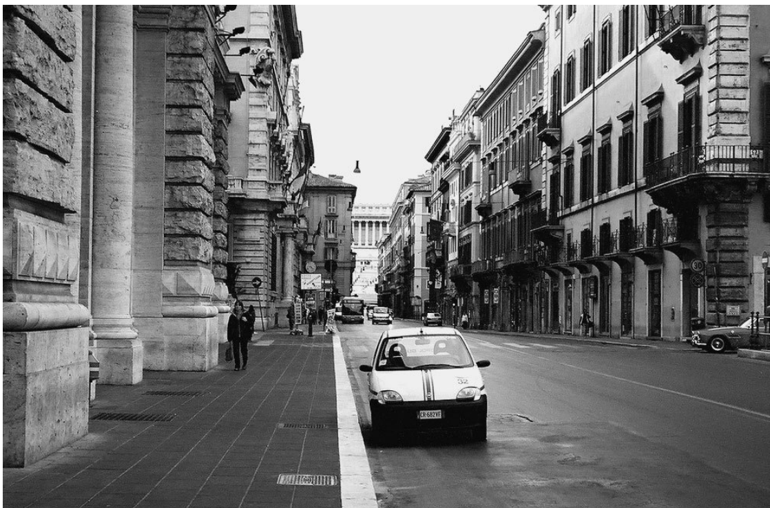
На улице Виа дель Корсо

Наиболее знаменитыми историческими памятниками этого стиля считаются колоннада и фасад собора Святого Петра, Пьяцца Навона с церковью Святой Агнессы и тремя фонтанами, церковь Санта-Мария делла Виттория. XVIII в. был ознаменован созданием таких шедевров, как фонтан Треви и лестница со 135 ступенями на площади Испании.