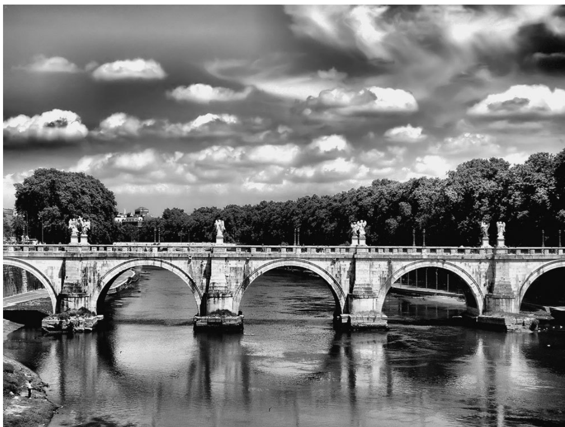
Тибр на территории Рима

Расположен Рим на холмистой равнине – Римской Кампанье, окруженной невысокими горами. Через Рим с севера на юг протекает река Тибр, которая делит город на две части. В античные времена по Тибру суда доплывали до центра города, сейчас же река несудоходна. Большая часть Рима находится к востоку от Тибра.