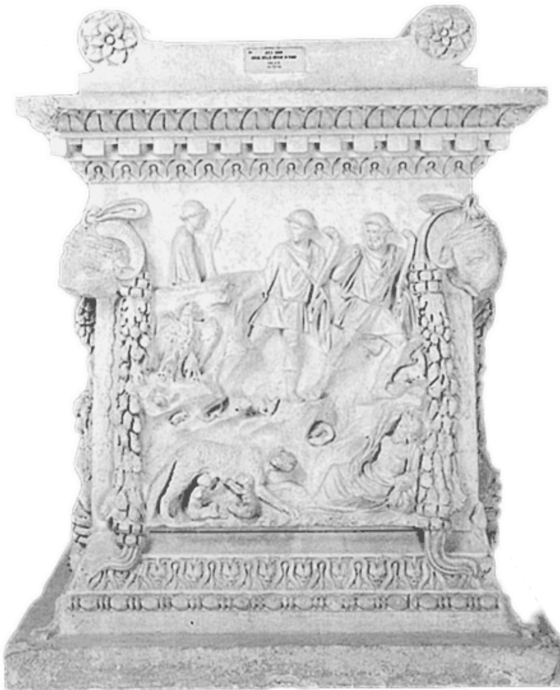
Алтарь из Остии с изображением Марса, Реи Сильвии и близнецов Ромула и Рема

По другому преданию, Рим основали беглецы из Трои, чьи корабли после долгого плавания прибило к берегу. Одна из женщин по имени Рома предложила измученным путникам остаться в этих краях, а чтобы нельзя было передумать, корабли были сожжены. В честь этой троянки и назвали город.