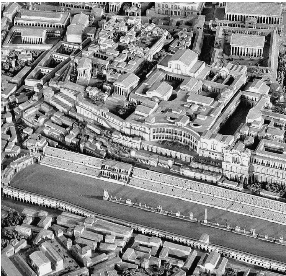
Панорама Палатина времен Римской империи. Реконструкция

до н. э.) приказал возвести храм покровительницы этого народа, богини Дианы. Авентин всегда считался местом жительства плебеев и бедноты.