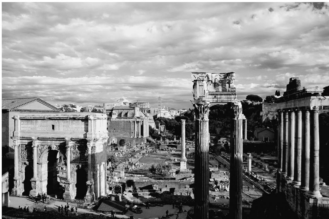
Форум в наши дни

Никто не может точно сказать, когда же на месте болота в низине у подножия холмов возник первый римский форум. Принято считать, что через 100 лет после основания Рима жители города осушили болото и устроили на этом месте рыночную площадь, где также проходили первые народные собрания.