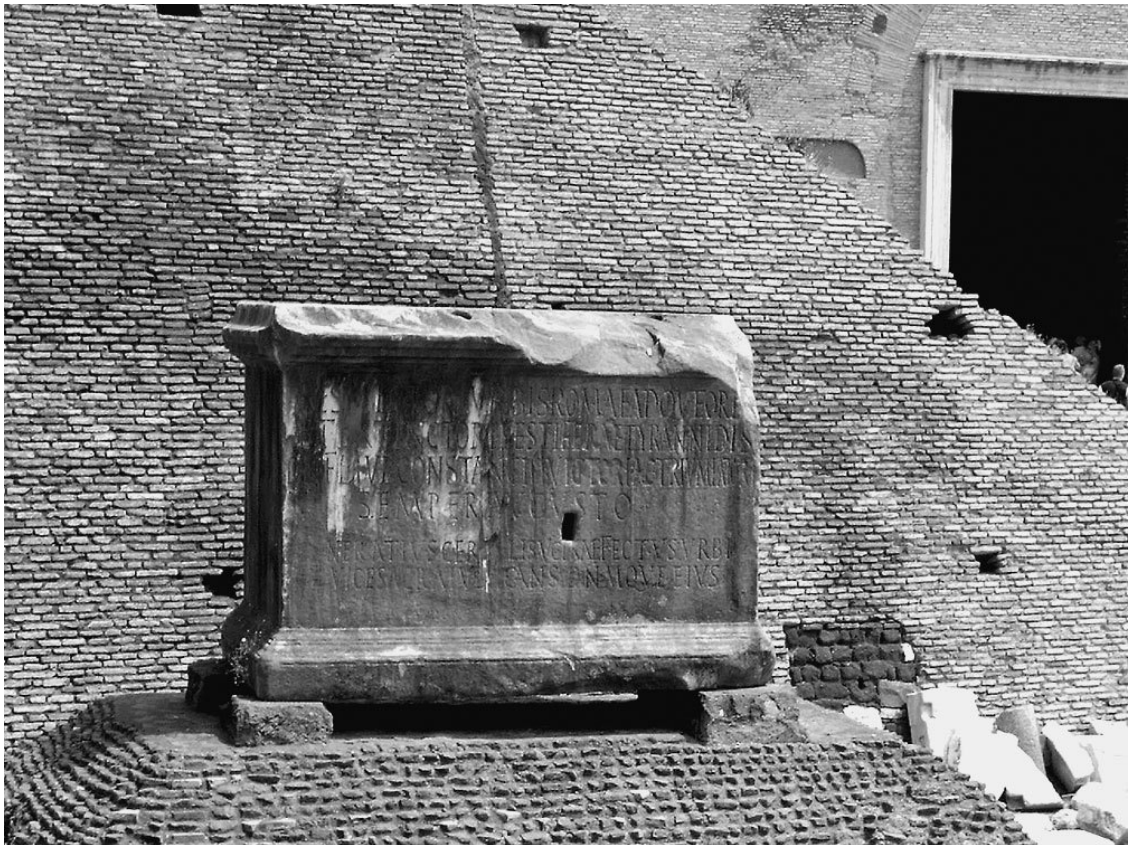
Лapis Нигер – черный камень