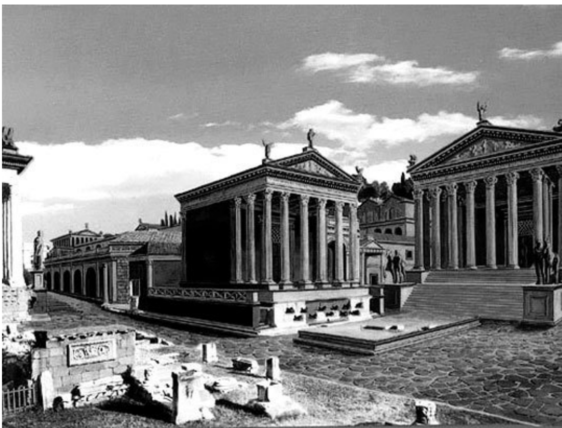
Форум Романум. Реконструкция

Когда-то здесь билось сердце древнего Рима, а теперь на месте городской площади от былого величия Вечного города остались лишь живописные развалины и руины, скрывающие множество загадок далекого прошлого.