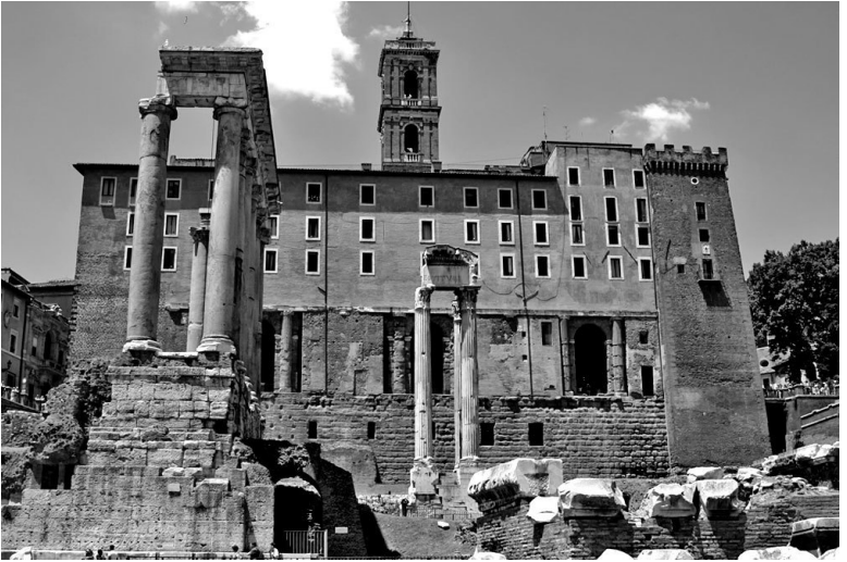
Табуларий – Дворец сенаторов

на острове Табулария. Это помогло уберечь от полного исчезновения главное хранилище документов и императорской казны.