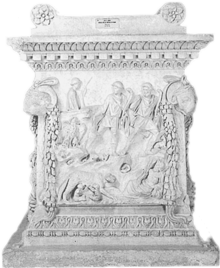
Алтарь из Остии с изображением Марса, Реи Сильвии и близнецов Ромула и Рема