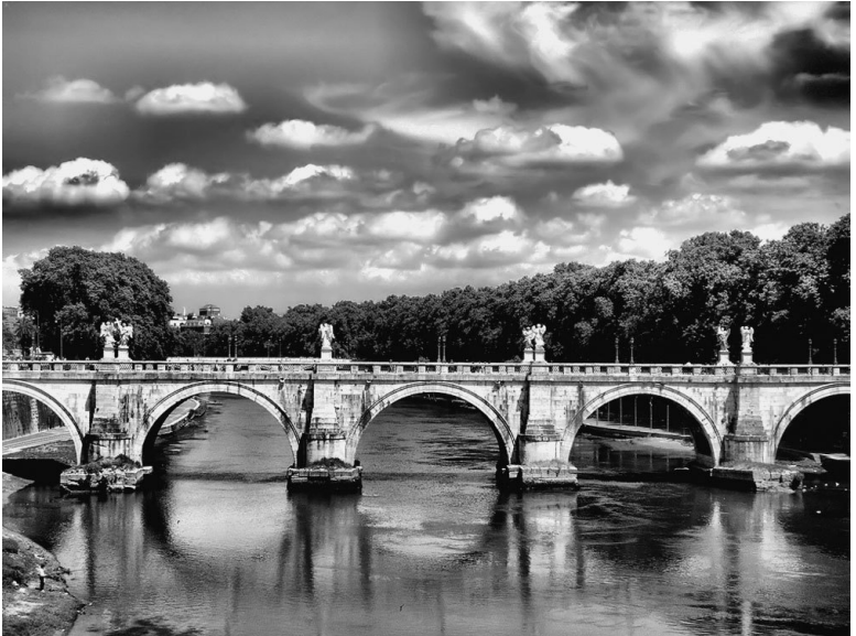
Тибр на территории Рима

Расположен Рим на холмистой равнине – Римской Кампанье, окруженной невысокими горами. Через Рим с севера на юг протекает река Тибр, которая делит город на две части. В античные времена по Тибру суда доплывали до центра города, сейчас же река несудоходна. Большая часть Рима находится к востоку от Тибра.