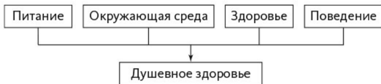
Рис. 1.1. Модель пяти доменов

из ключевых отличий в том, что мы должны думать не только о предотвращении вреда, но и о том, как обеспечить позитивные впечатления. Другими словами, для хорошего самочувствия животным (и домашним собакам тоже) надо делать то, что им нравится.