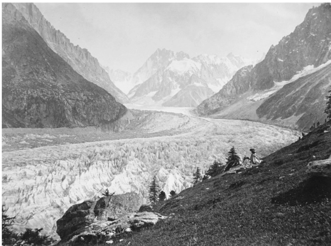
Рис. 2.3. Ледник Мер-де-Глас во Французских Альпах, где Джон Тиндаль и Джеймс Дэвид Форбс изучали движение ледников

До недавнего времени никто не задумывался над тем, что ледники могут двигаться, и уж тем более не пытался понять, как именно это происходит. Исключение составляли жители Альп, занимавшиеся в основном разведением скота. Год за годом они наблюдали как малозаметные, так и вполне явные признаки того, что лед находится в постоянном движении: выбоины и борозды на горных склонах, нагромождения камней у подножия ледников. Иногда в горах случались катастрофы, когда ледяные плотины, сдерживающие внутренние ледниковые озера, прорывало и масса талой воды вместе с гигантскими глыбами льда обрушивалась на безмятежные долины. За столетия альпийские пастухи накопили немало знаний о ледниках, но никому из благородных ученых мужей не приходило в голову обратиться к ним с вопросами.