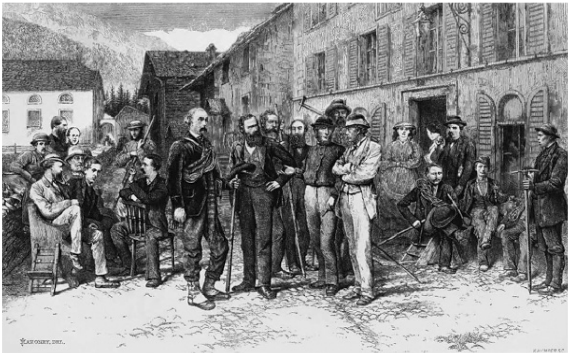
Рис. 2.4. Тиндаль (в центре справа, с бородой и в шляпе) вместе с другими членами Альпийского клуба возле здания, где проходили собрания клуба, в Церматте, Швейцария.

Открытия и находки, сделанные под поверхностью земли, заставили геологов начала XIX в. по-новому взглянуть и на то, что находилось на ее поверхности и что прежде они не замечали или не считали важным. Так, их внимание привлекли эрратические валуны – каменные глыбы, совершенно чуждые окружающему ландшафту, – которые всегда изумляли местных жителей. Рядом с этими валунами часто находили странные отложения, представлявшие собой беспорядочную смесь обломков пород различных размеров и форм. Эти отложения стали неразрешимой загадкой для первых поколений геологов, чей главный и единственный метод анализа структуры Земли был основан на сравнении окаменелостей, находившихся в последовательности осадочных слоев.