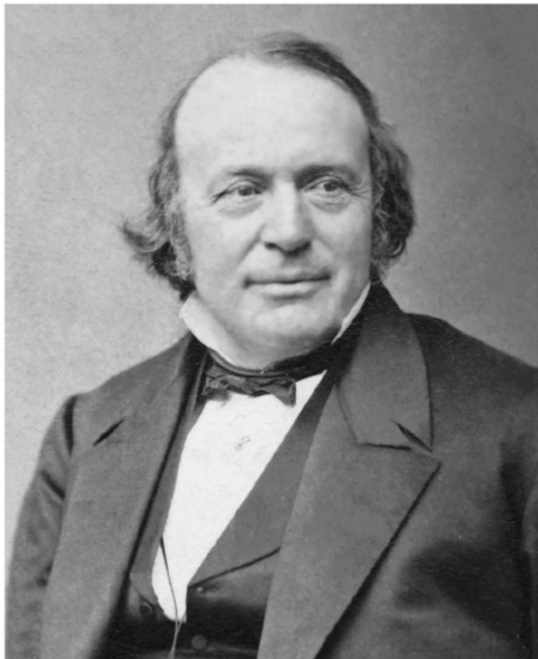
Рис. 2.5. Швейцарский геолог Луи Агассис, в 1840 г. выдвинувший смелую гипотезу о ледниковом периоде

В 1840 г. Луи Агассис выдвинул смелое предположение, навсегда изменившее представление ученых и обычных людей о льде. Синтезировав идеи коллег, Агассис заявил, что эрратические валуны и глинистые отложения могли быть следами гигантского ледяного щита, который некогда покрывал значительную часть Европы и Северной Америки. Гипотеза о ледниковом периоде не только подняла множество вопросов (действительно ли шерстистые мамонты бродили по территории Англии в то время, когда ее уже населяли люди?), но и бросила вызов общепринятой версии истории Земли. Существование в прошлом огромных ледяных щитов казалось большинству людей того времени немыслимым, поскольку это означало, что раньше на Земле было намного холоднее 17 .