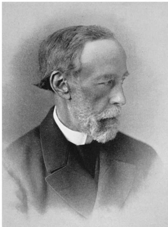
Рис. 2.6. Ученый-самоучка Джеймс Кролл поразил Чарльза Дарвина и Джона Тиндаля гипотезой, согласно которой многочисленные ледниковые периоды в прошлом были связаны с астрономическими циклами планеты, влиявшими на климат через такие «вторичные причины», как вариации отражения солнечного излучения льдом и облаками и вызванные этим изменения ветров и океанических течений

Подход Кролла был необычен в двух отношениях. Во-первых, он фактически отвергал материальные свидетельства, предоставленные геологической наукой, и не скрывал отсутствия интереса к научным «фактам и данным», полученным эмпирическим путем. (Заняв в конце концов место секретаря в Шотландской геологической службе, Кролл с удовлетворением отмечал, что эта работа «не требует глубокого знакомства с геологией», поэтому «избавляет мой разум от необходимости изучать науку, к которой я не имею большого пристрастия, и дает возможность посвятить все часы моего досуга занятию теми физическими вопросами, которые меня столь увлекают».) 23 А во-вторых, Кролл был мыслителем, стремившимся видеть общую картину. Отбросив груз разрозненных геологических данных вкупе с призванными объяснить их гипотезами, сводившимися к поднятию и опусканию континентов и наводнениям, он обратил свой взор на самый масштабный фактор, какой только можно было представить, – переменный эксцентриситет земной орбиты. И вот тут-то ему и удалось совершить настоящий прорыв: вместо того чтобы согласиться с утверждением Гершеля, что изменения климата на Земле