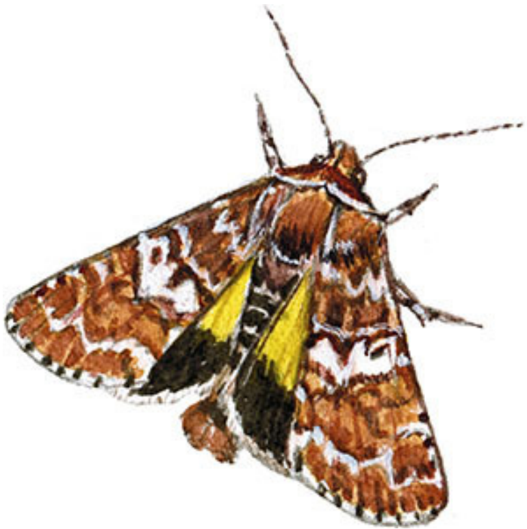
Пестрая вересковая совка

Совы – ночные птицы, и то же касается их тезок-бабочек из семейства совок. Но тут есть исключения. Гуляя днем по верховым болотам и вересковым пустошам, если повезет, вы можете встретить сразу двух дневных членов семейства: пеструю вересковую совку ( Anarta myrtilli ) и вид Coranarta