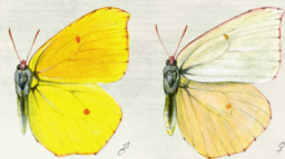
Gonerpteryx elabula palmas (La Palma)