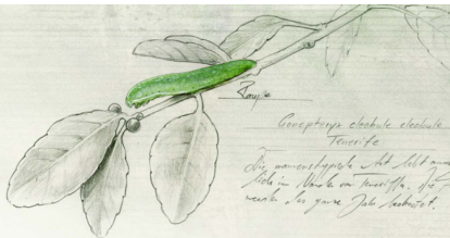
Gonerpteryx elabula elabula Tenerife

Die Gonerpteryx elabula elabula ist eine der schönsten und größten der Gattung Gonerpteryx.