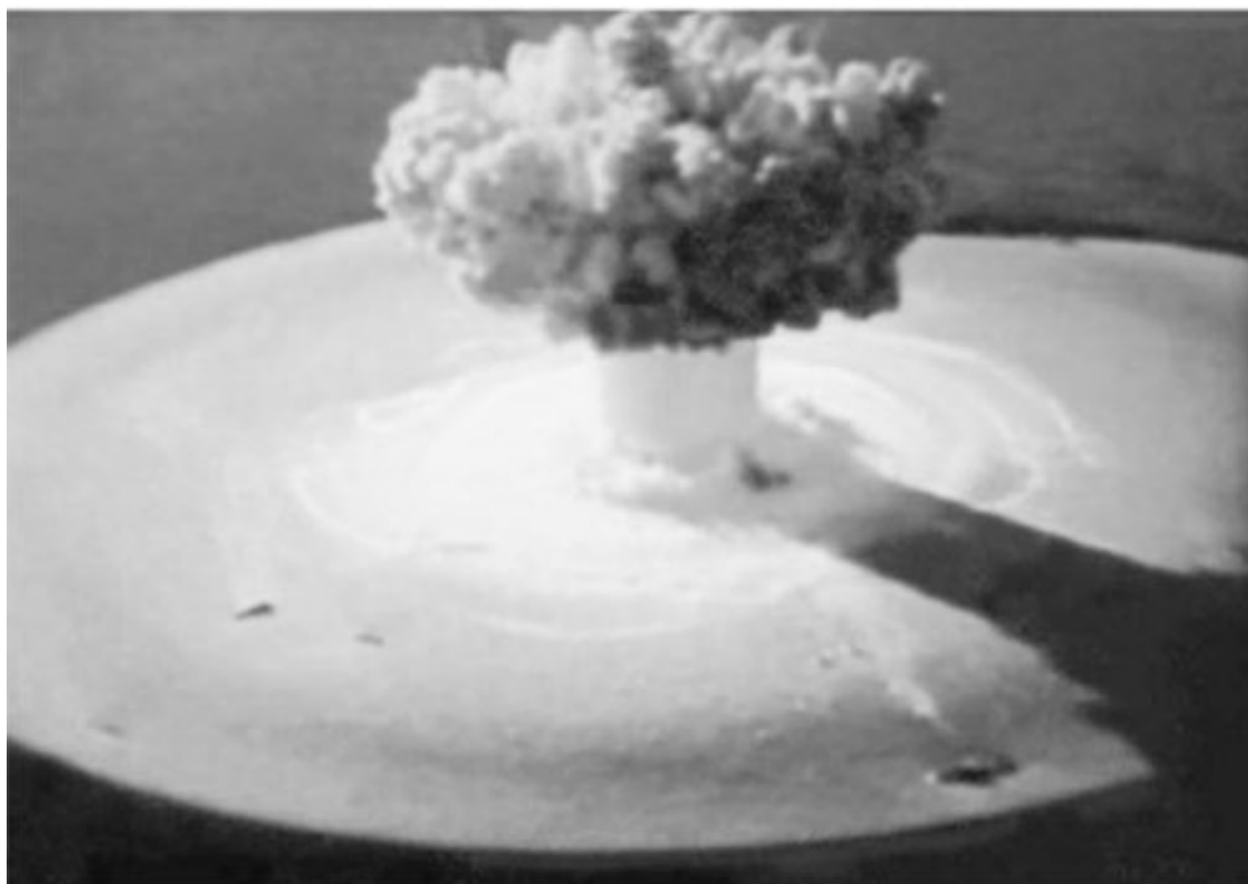
Два этапа атомного взрыва

Тот сразу же определил, что боль на кончике языка вызвана сердечной недостаточностью.