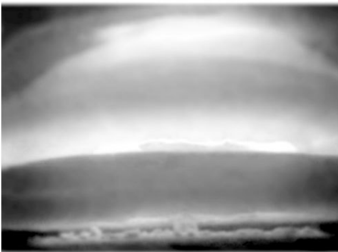
Две стадии взрыва