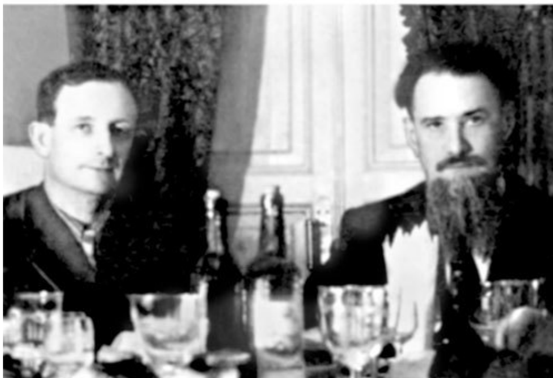
Харитон и Курчатов во время поездки на полигон

Позже он говорил, что «лучшие медики служат, конечно же, на полигонах».