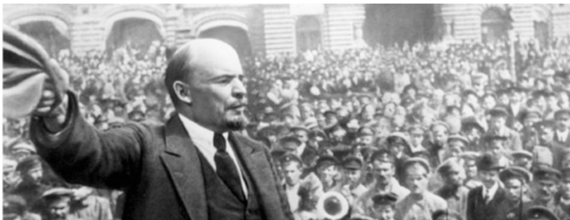
В. И. Ленин, февраль, 1917 г.

Современные молодые люди мало интересуются историей, и живут сегодняшним днём. А те, кто когда-то знал, но основательно подзабыл её, могут освежить память, прибегнув к любым источникам информации. Лично мне не хочется продолжать это повествование на эмоциональной волне, так как речь идет только о цифрах и о людях, стоящих за этими цифрами, пришедших на эту Землю, для выполнения той или иной миссии, выполнивших свое предназначение или с треском его проваливших.