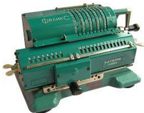
Механический калькулятор «Феликс»

Поступки родных нам людей создают погоду в нашей собственной семье, поступки окружающих индивидов приводят к той или иной ситуации вокруг нашей зоны обитания. Поступки политиков формируют политический климат не только в собственной стране, но и на всей планете. Для того чтобы мой дорогой читатель не уснул, листая эту книгу, начинаю выполнять данное в начале Вам обещание.