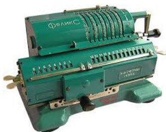
Механический калькулятор «Феликс»

начинаю выполнять данное в начале Вам обещание.