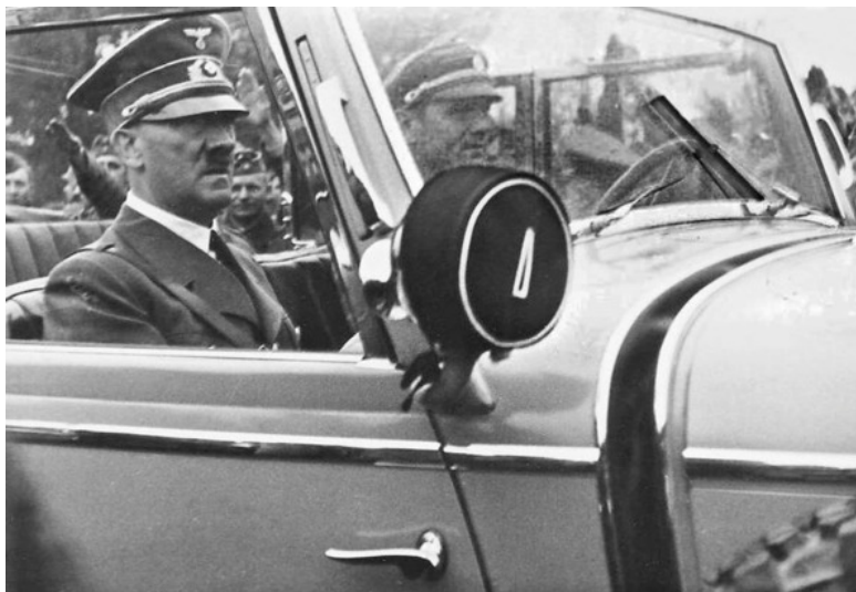
Адольф Гитлер в Польше, на оккупированной территории, 1939 г.

подпитки (начальник – подчиненный), а с возрастом от населения всей страны (массовые шествия, почитание), этому так же способствовал и культ личности. В случае с Адольфом Гитлером, частые перепады настроения и импульсивность, тоже были одним из способов регулирования энергии, пополнения и сброса лишней, ощущение огромной власти, над покоренными народами, помогало ему в этом.