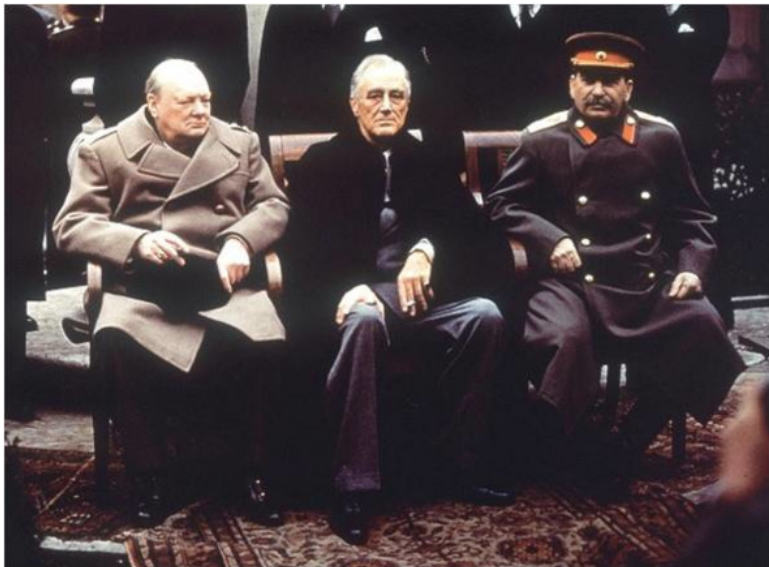
Ялтинская конференция 1945 год.