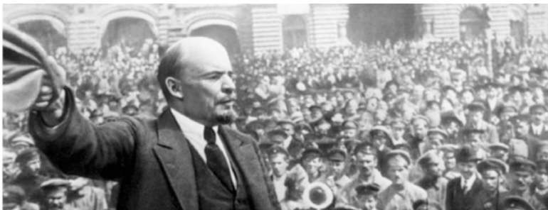
В. И. Ленин, февраль, 1917 г.

Современные молодые люди мало интересуются историей, и живут сегодняшним днём. А те, кто когда-то знал, но основательно подзабыл её, могут освежить память, прибегнув к любым источникам информации. Лично мне не хочется продолжать это повествование на эмоциональной волне, так как речь идет только о цифрах и о людях, стоящих за этими цифрами, пришедших на эту Землю, для выполнения той или иной миссии, выполнивших свое предназначение или с треском его проваливших.