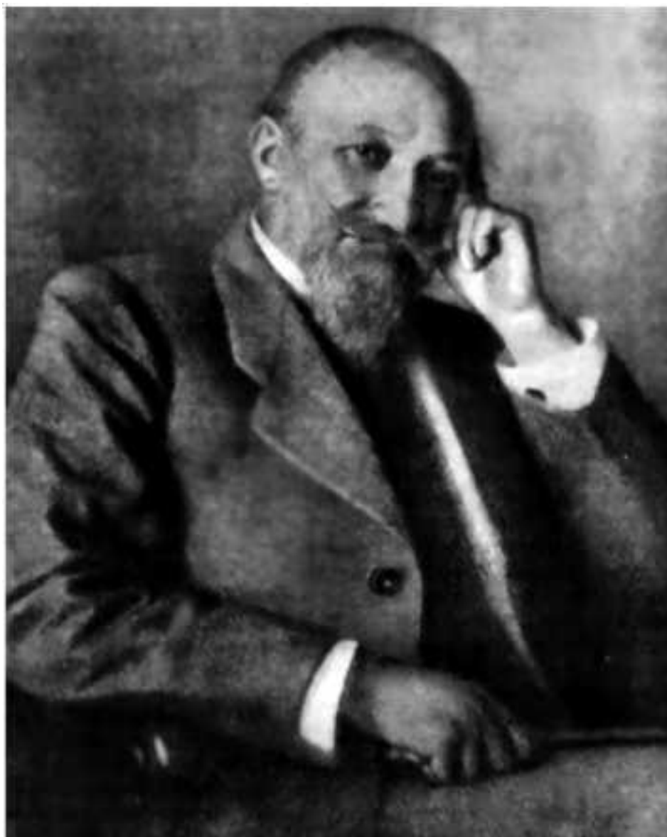
Рис. 1. Габриэль Ферран

Это была пылкая натура с острым, пронизательным умом, ученый широких интересов, чья кипучая мысль всегда раздвигала избранное поле исследования далеко за привычные исторические и географические пределы, выполняя работу сразу нескольких специалистов. Разносторонний эрудит, он, однако, не был лишь блистательным книжником, и его рабочий кабинет на тихой парижской улице совсем не походил на башню из слоновой кости. Учителем его был африканист Рене Бассе, друзьями-соратниками – арабист Годфруа-Демомбин и египтолог Тюрро-Данжен, индианист Сильвэн Лева и синолог Пельо, десятками нитей он был связан со многими другими представителями современного ему востоковедения, и все они сходились на заседаниях Азиатского общества, где из их докладов о результатах проделанных изысканий, как Феникс из пепла, частица за частицей воссоздавалась живая ткань великой культуры разноязычного Востока минувших эпох; они возводили на пьедестал науки новые положения, поражавшие неожиданностью, и ниспровергали старые, казалось, незыблемые, убеждались и убеждали, спорили и учились друг у друга.