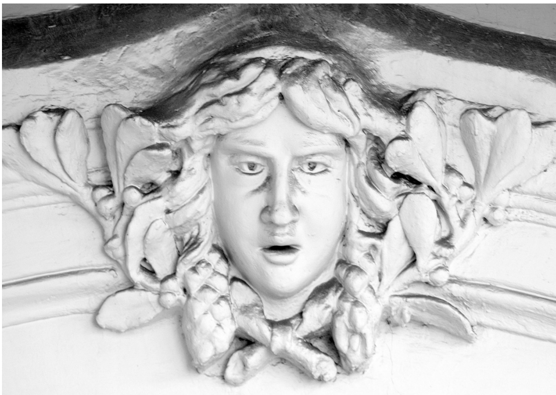
«Каменные лица Ростова»