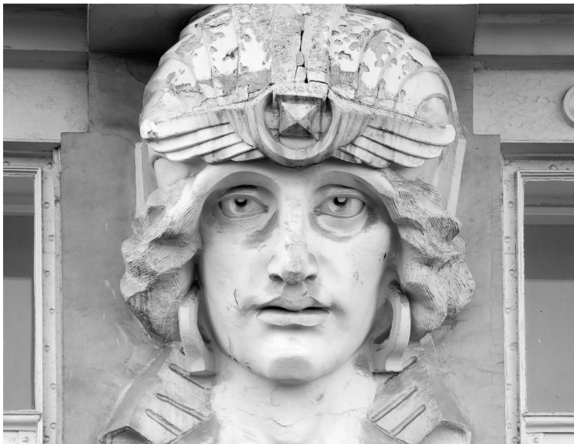
«Каменные лица Ростова»