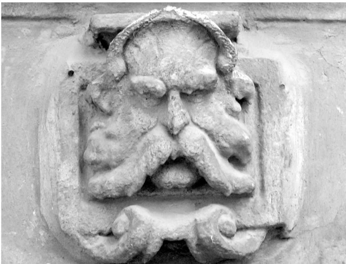
«Каменные лица Ростова»