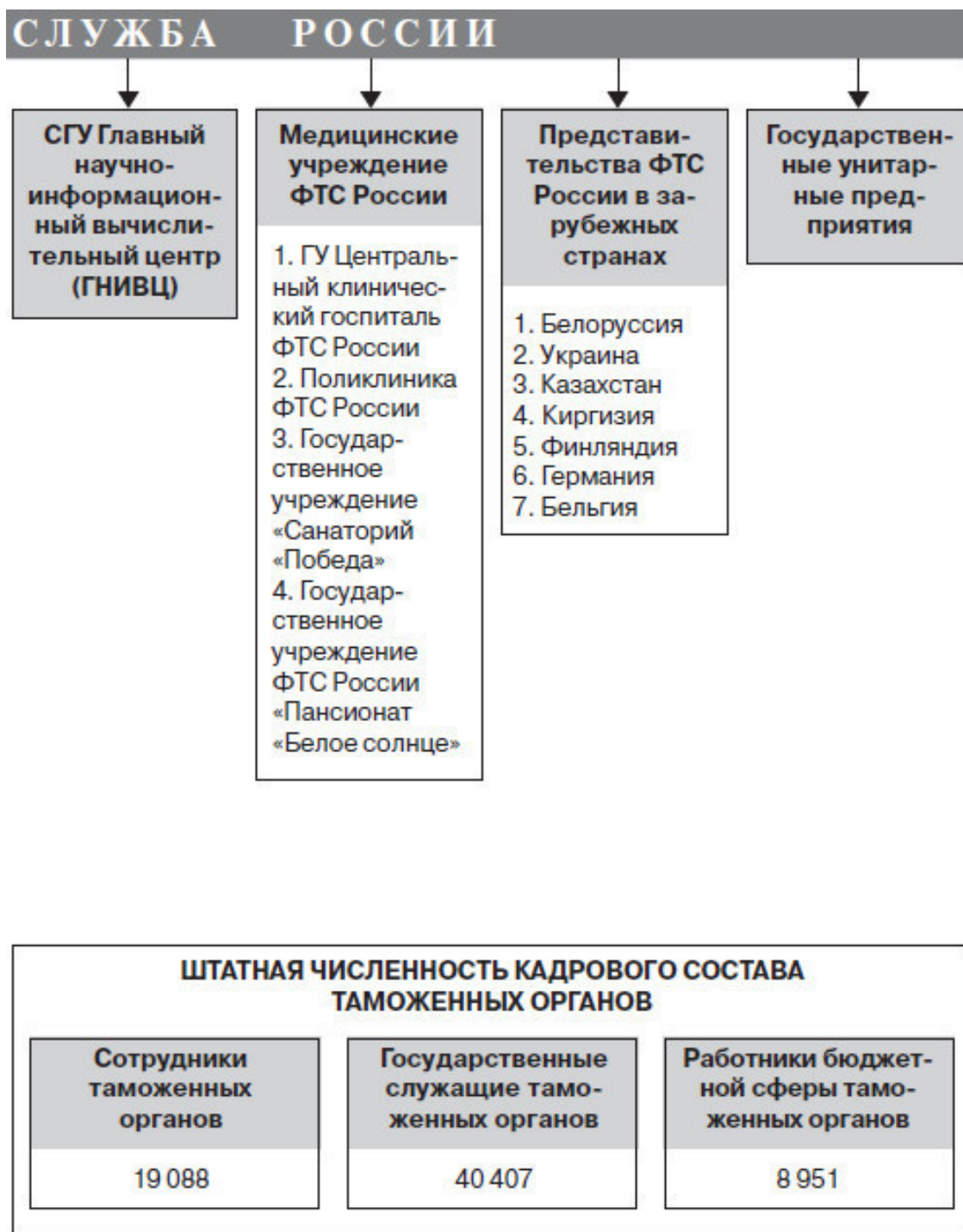
Рис. 2. Структура таможенных органов Российской Федерации и организаций ФТС