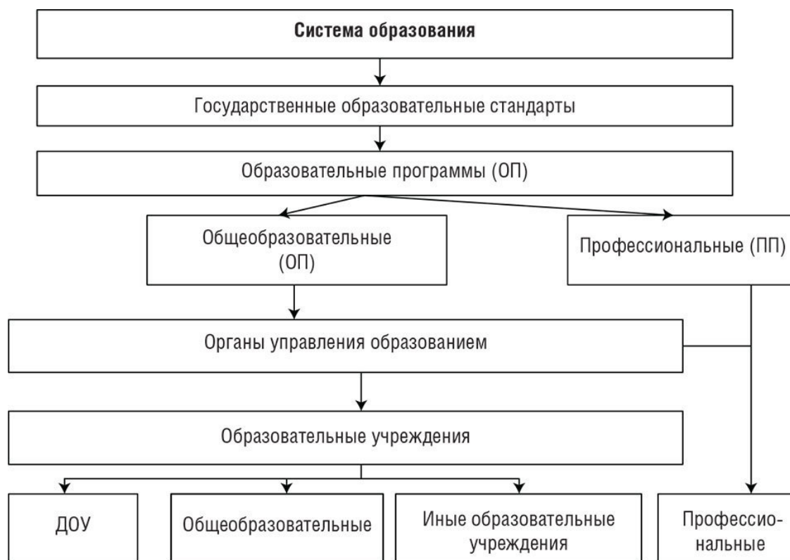
Рис. 2. Структура системы образования

Система образования осуществляет две взаимосвязанные функции: внешнюю (оказание образовательных услуг) и внутреннюю (обеспечение условий для собственного функционирования и развития). При этом реализации внешней функции препятствует ряд ограничений, к которым относятся правовые нормы, регламентирующие деятельность отрасли, и ресурсное обеспечение учебных заведений (материально-техническое, кадровое, организационное, финансовое, информационное).