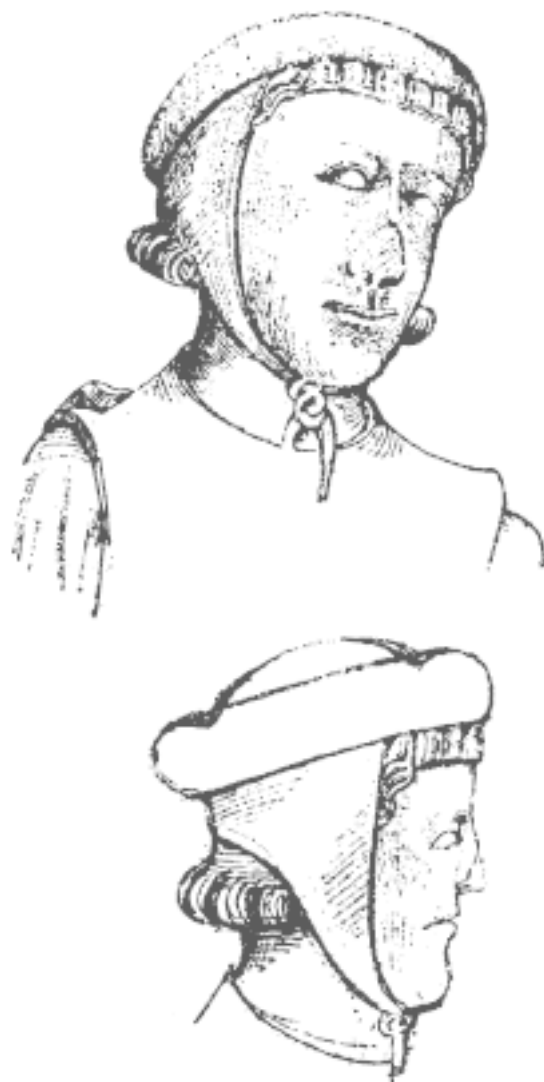
Рис. 5. Боевые шапки. Фрагменты статуй на западном фасаде собора в г. Уэлс, около 1230–1240 гг.