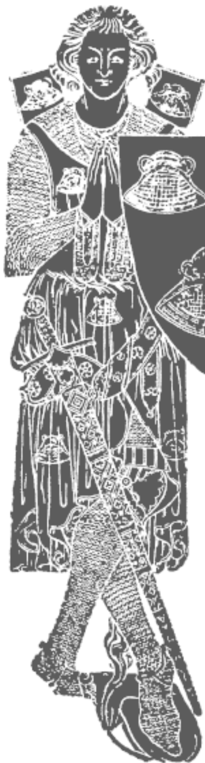
Рис. 7. Медная мемориальная доска сэра Роберта де Сетванса, 1306 г. Чартхэм, Кент. Обратите внимание на стеганные штаны, к которым прикреплены наколенники, и вырез акетона. См. также рис. 103

Самую раннюю ссылку на применение пластинчатой брони мне удалось обнаружить в отчете Гиральдуса Камбрэнзиса о набеге датчан на Дублин 16 мая 1171 г. Согласно его описанию, датчане были одеты либо в длинные кольчуги, либо в одежды из железных пластин. Эта броня из железных пластин вполне могла быть пластинчатой курткой, описанной ниже, но могла быть и ламеллярной и чешуйчатой броней. Более определенное свидетельство представ-