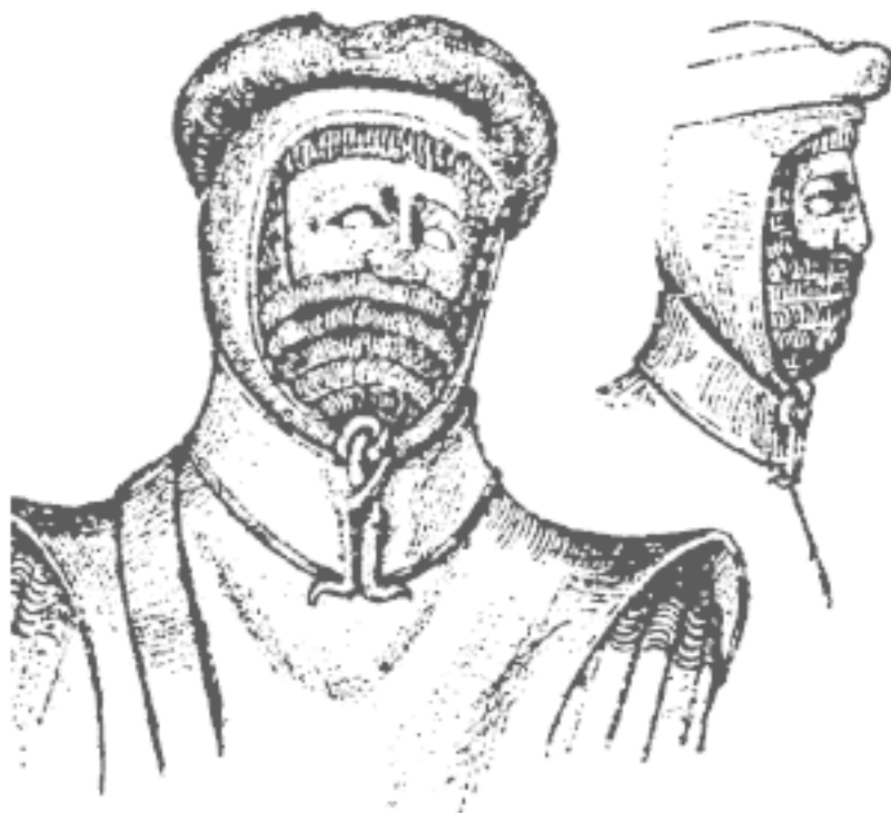
Рис. 6. Боевая шапочка, очевидно предназначенная для поддержания шлема. Деталь статуи с западного фасада Велльского собора, около 1230–1240 гг.

Начиная приблизительно со второй четверти XIII в. под шоссы стали надевать защитные стеганные штаны ( gamboised cuisses ). С течением времени их все чаще стали носить поверх шоссов (рис. 4). Великолепное изображение человека, надевающего стеганные штаны, в Мачейовской Библии показывает, что они скорее напоминали пару вертикально простеганных болотных сапог, обрезанных ниже колен. Снизу их закрепляли ремнем, завязанным вокруг ноги ниже колена или ремешком с пряжкой. Некоторые изображения показывают стеганные штаны, украшенные вышивкой.