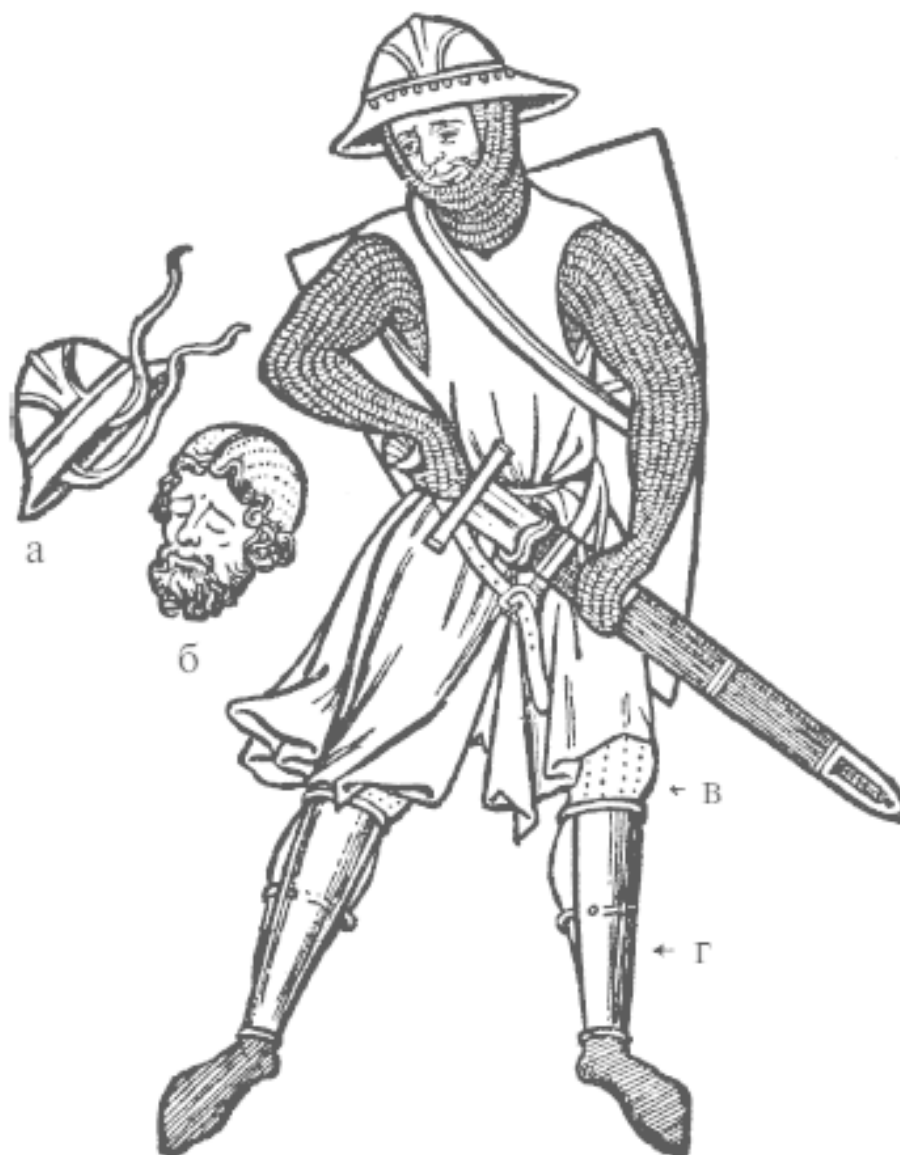
Рис. 4. Рисунки из Мачейовской Библии. Франция, около 1250 г. Библиотека Пирпонта Моргана, Нью-Йорк. Обратите внимание на: а) кабассет с ремешками; б) боевую шапку; в) стеганные штаны; г) наголенники

Кроме того, кабассет являлся головным убором рядовых воинов, вероятно, потому что был прост и дешев и легко мог быть изготовлен в больших количествах. Но он также широко использовался и среди рыцарей. Например, Жуанвиль в своей книге «Жизнь святого Людовика» описывает, как однажды в Иерусалиме, убедив короля Людовика снять свой шлем, он отдал ему свой кабассет, чтобы король смог «отдышаться».