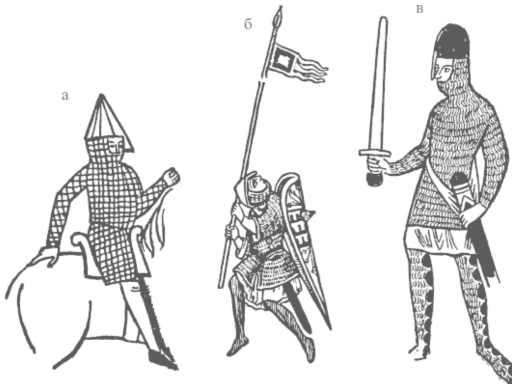
Рис. 1. Фрагменты раскрашенных миниатюр: а – Апокалипсис Святого Севера. Франция, создано между 1028 и 1072 гг. Национальная библиотека, Париж; б – Уинчестерская Библия. Англия, около 1170 г. Собор в Уинчестере; в – Псалтырь Святого Луи. Англия, около 1200 г. Университетская библиотека г. Лейдена (Нидерланды)

Как было сказано выше, существует некоторое сходство, выделяющее капюшоны на гобелене Байё в особую группу. Даже если это так, то тенденция эта, похоже, долго не продержалась, поскольку до третьей четверти XIII в. не найдено других изображений кольчужных капюшонов. Нет также изображений кольчужной рубахи с прикрепленным капюшоном, но многие иллюстрации XIII в. показывают капюшоны с откидным клапаном ( ventail ), которым можно было прикрыть нижнюю часть лица и который закреплялся ремешком с пряжкой или шнурком на другой стороне головы.