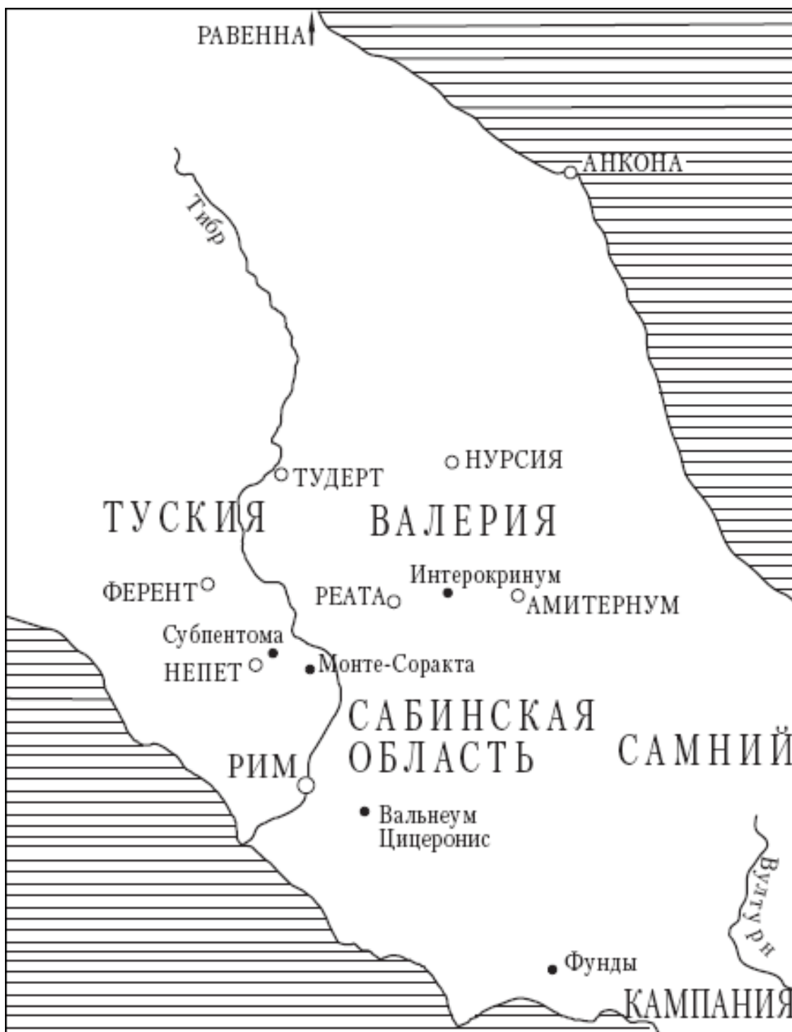
Карта Средней Италии V–VI века

1. Однажды, слишком отягощенный беспокойством от мирских дел, которые нередко вынуждают нас оставлять собственные наши дела, чего бы никак не должно быть, я удалился в одно уединенное место, отрадное для скорбящей души. Там, на свободе, я удобнее мог разо-