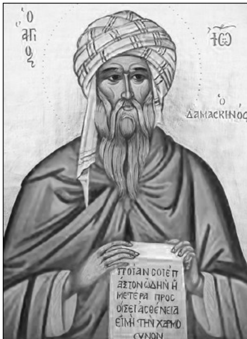
Преподобный Иоанн Дамаскин