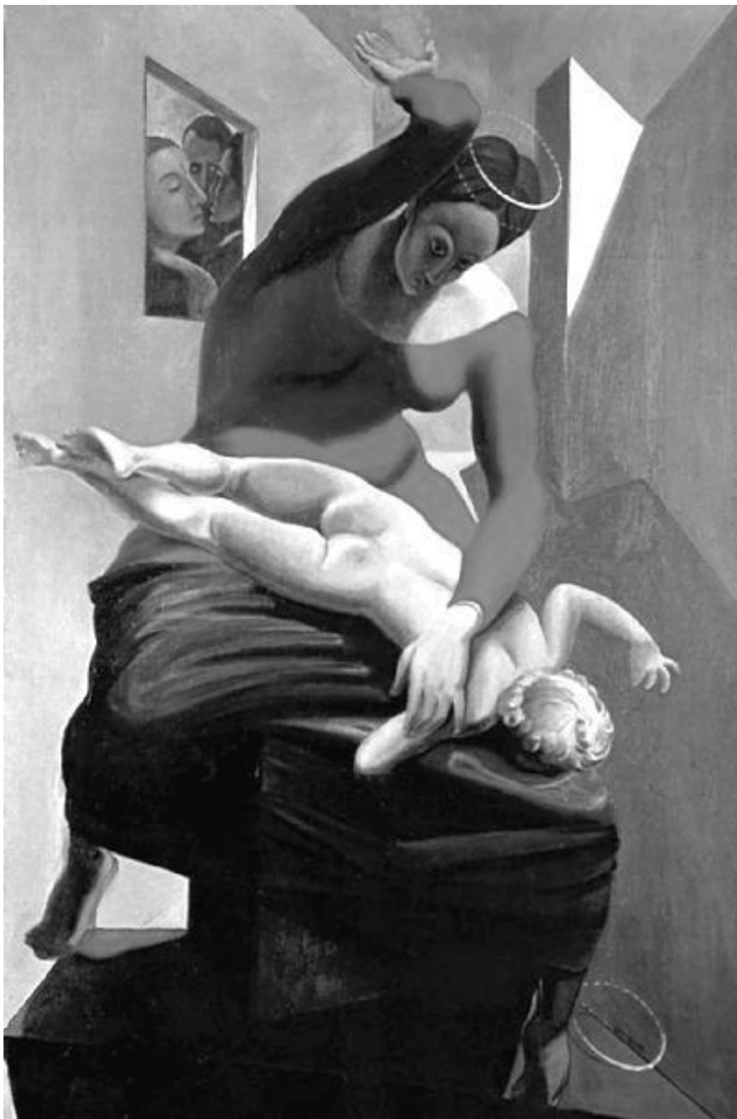
Пресвятая Дева наказывает младенца Христа. Художник Макс Эрнст