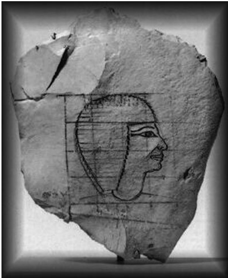
Голова Сененмута. набросок

И вот традиционный церемониал стал меняться. Теперь