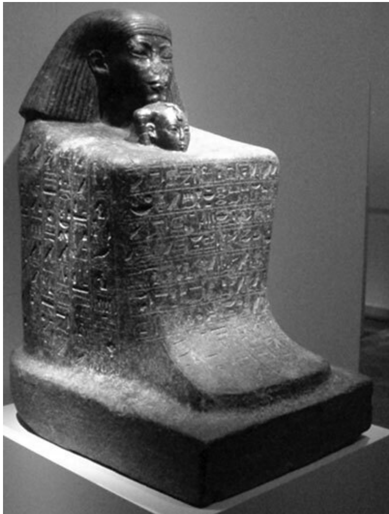
Статуя зодчего Сененмута с царевной Нефрура