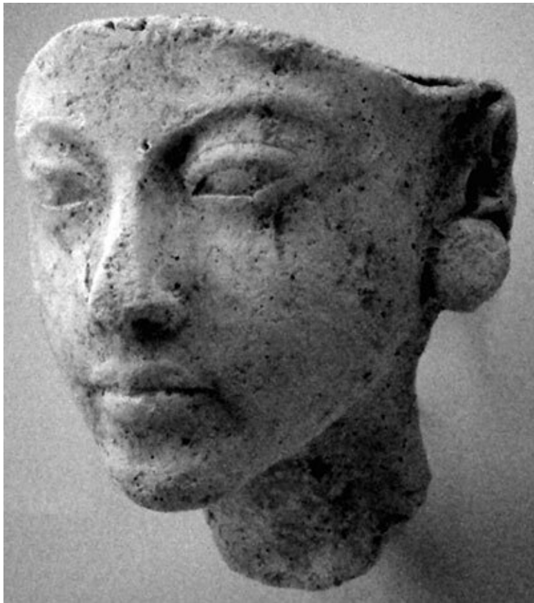
Отливка маски. Предположительно третья дочь Нефертити – Анхесенпаатон. XIV в. до н. э.

И вот царь Вавилона Буриаш, которого в свое время