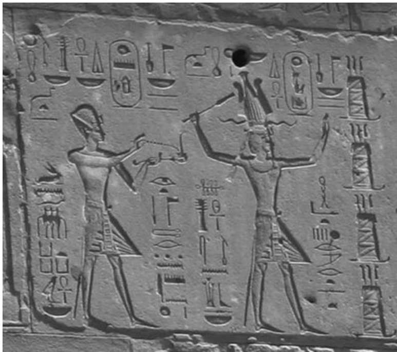
Рельеф из «Красного святилища» в Карнаке, изображающий Хатшепсут рядом с Тутмосом III

В последнее же время преобладает другая точка зрения. Утверждают, что Хатшепсут – умный правитель, миротворец, созидатель.