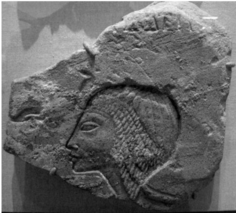
Нефертити в нубийском парике. Рельеф. XIV в. до н. э.

Идеи Эхнатона, слова о том, что солнце равно любит и египтян, и вавилонян, и хеттов, соседей почему-то не утешают. Им хочется золота.