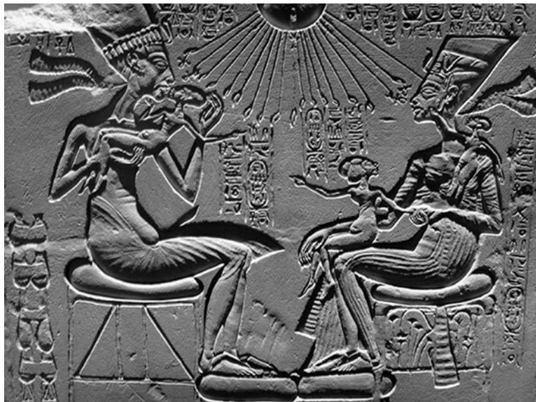
Эхнатон и Нефертити с дочерьми. XIV в. до н. э.

струкций – длительный, мучительный процесс, он запечатлен на рисунках древних египтян. Многотонные детали медленно двигали и долго шлифовали мокрым песком. При Эхнатоне же стали строить из маленьких, заранее заготовленных блоков. Получались совершенно иные дома. Кстати, потому город и был потом так легко разрушен.