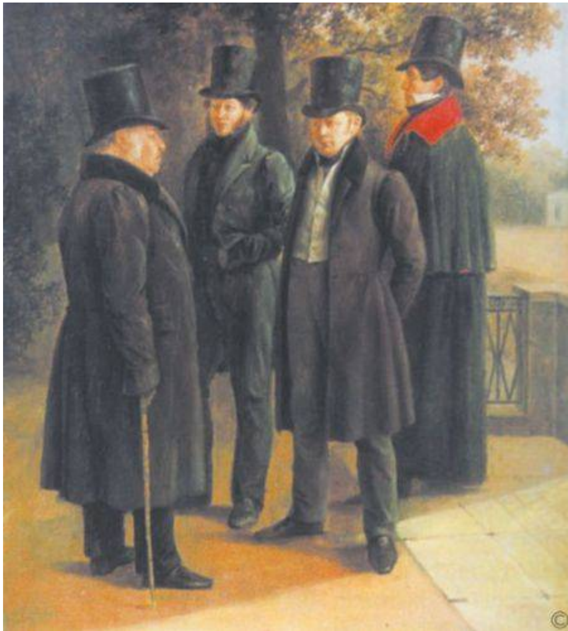
И.А. Крылов, А.С. Пушкин, В.А. Жуковский, Н.И. Гнедич.

Яркой страницей его жизни было также участие в Отечественной войне 1812–1814 гг. В чине поручика Жуковский был зачислен в Московское народное ополчение и вместе со своим полком прошел всю военную кампанию 1812 г. – самый трудный и героический период войны с Наполеоном. В этом году было написано самое значительное произведение поэта, получившее широкое распространение в русской армии, – «Певец во стане русских воинов».