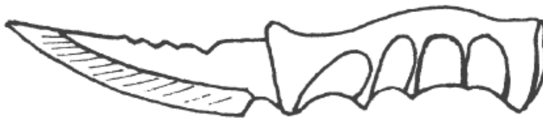
Рис. 1. Нож-скинер

Нескладной охотничий нож. Основными функциями охотничьего ножа являются разделка и снятие шкуры с дичи. От этих функций зависит и конструкция охотничьего ножа. Ножи для снятия шкуры (скинеры) широкие и имеют удобную форму (рис. 1). Ножи для разделки дичи имеют ярко выраженный скос обуха, поэтому кончик клинка находится почти на средней линии рукояти (рис. 2). Таким ножом хорошо наносить колющие удары.