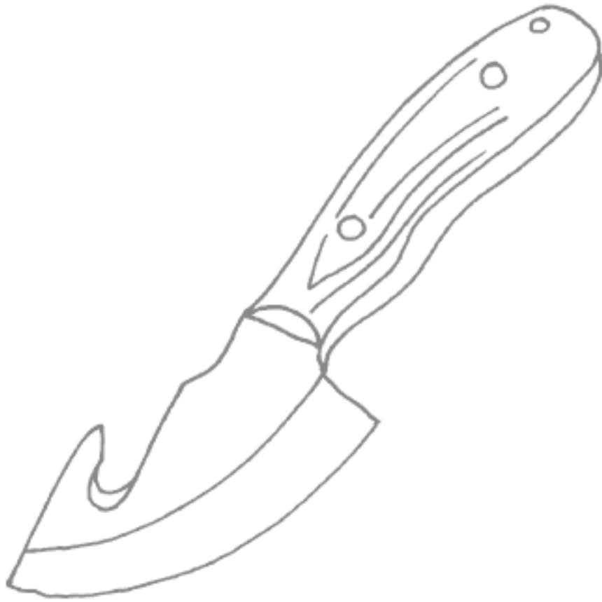
Рис. 3. Шкуродерный нож