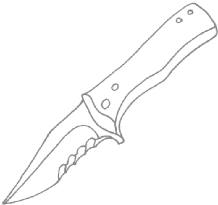
Рис. 4. Нож с серейторной заточкой

Среди ножей для снятия кожи есть такие, у которых практически отсутствует рукоять, т. е. ножи скелетного типа. Но такие ножи, как правило, выполняют лишь вспомогательную функцию и должны идти в комплекте с основным ножом.