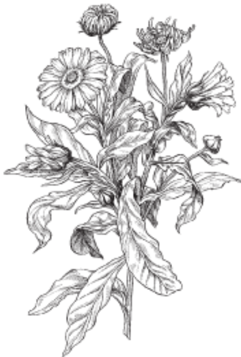
Ноготки лекарственные (календула)

Ноготки лекарственные относятся к семейству сложноцветных – Compositae . Поскольку растение является однолетним, каждый год оно отмирает к зиме и размножается посевом семян весной. Высота его не превышает 70 см, но, как правило, средний размер меньше – 20–50 см.