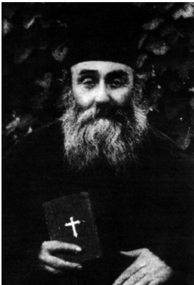
Святой Николай Планас, священник (f1932)

После вновь послышался шепот: «Прибыл экипаж, приехал отец Николай». Он служил литургию, весь переполненный счастьем. Маленькие дети, чистые как ангелы, видели, что он не ступает по земле, а приподнимается над ней. Он ничего не ел, только причащался, спал лишь один час днем и ел хлеб с водой.