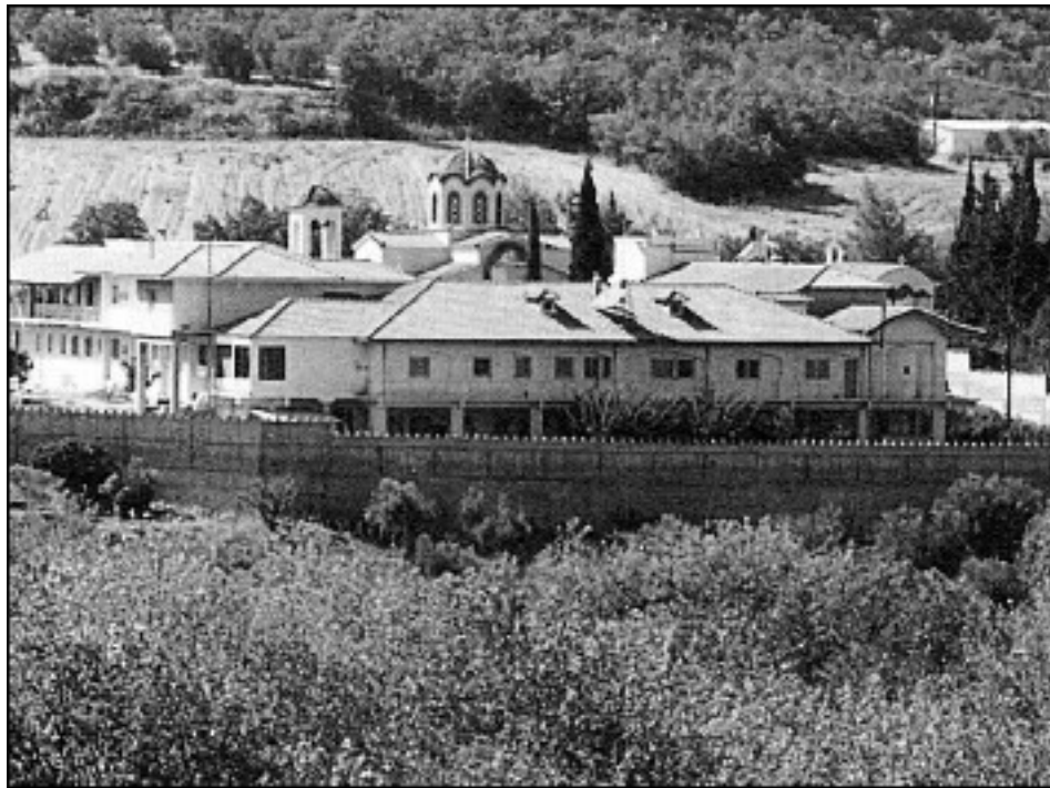
Молос. Монастырь Пресвятой Богородицы Одигитрии

Особенно важна их публикация в нашу «новейшую» эпоху, когда евангельский дух, являемый в подвижничестве и молитвенных помыслах, изгоняется из повседневной жизни с бесовской одержимостью. Догматическое сознание современных христиан часто помрачено, поэтому они теряют ориентиры и отступают от святоотеческого, православного благочестия и веры.