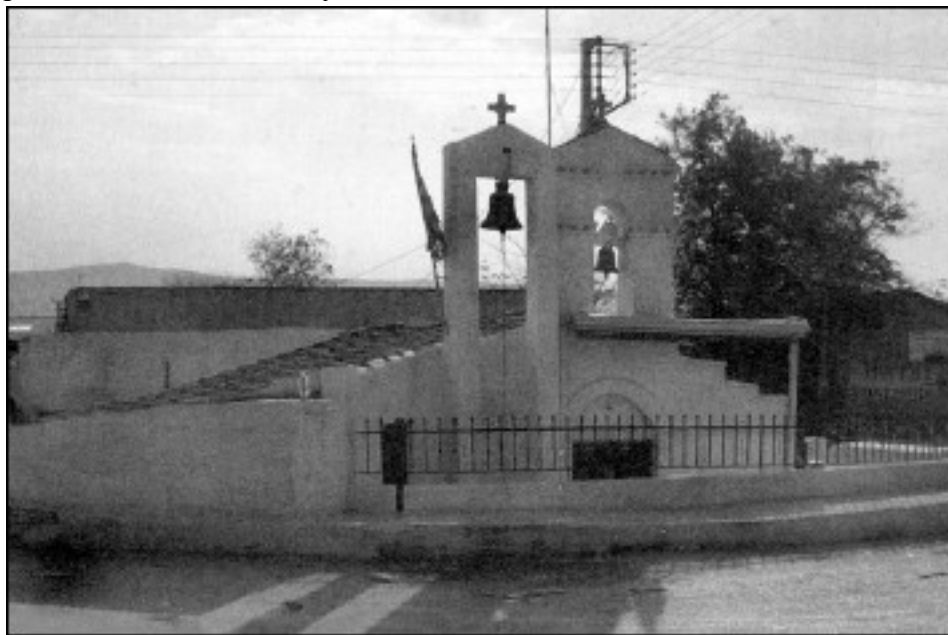
Храм Святой Троицы на углу улиц Орфея и Праведной Анны в Вотаниконе