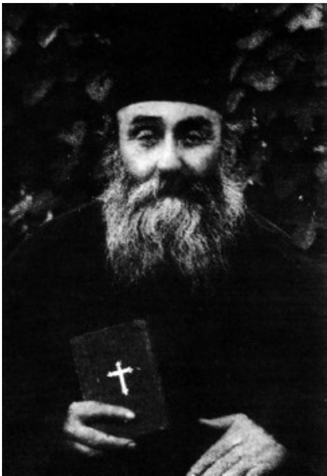
Святой Николай Планас, священник (f1932)