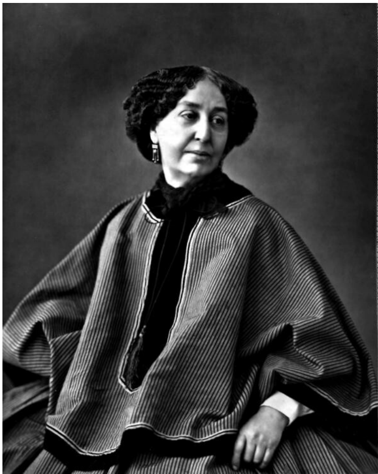
Надар (Гаспар Феликс Турнашон). Портрет Жорж Санд. 1877 г. [Здесь и далее: ] Частное собрание. Москва.