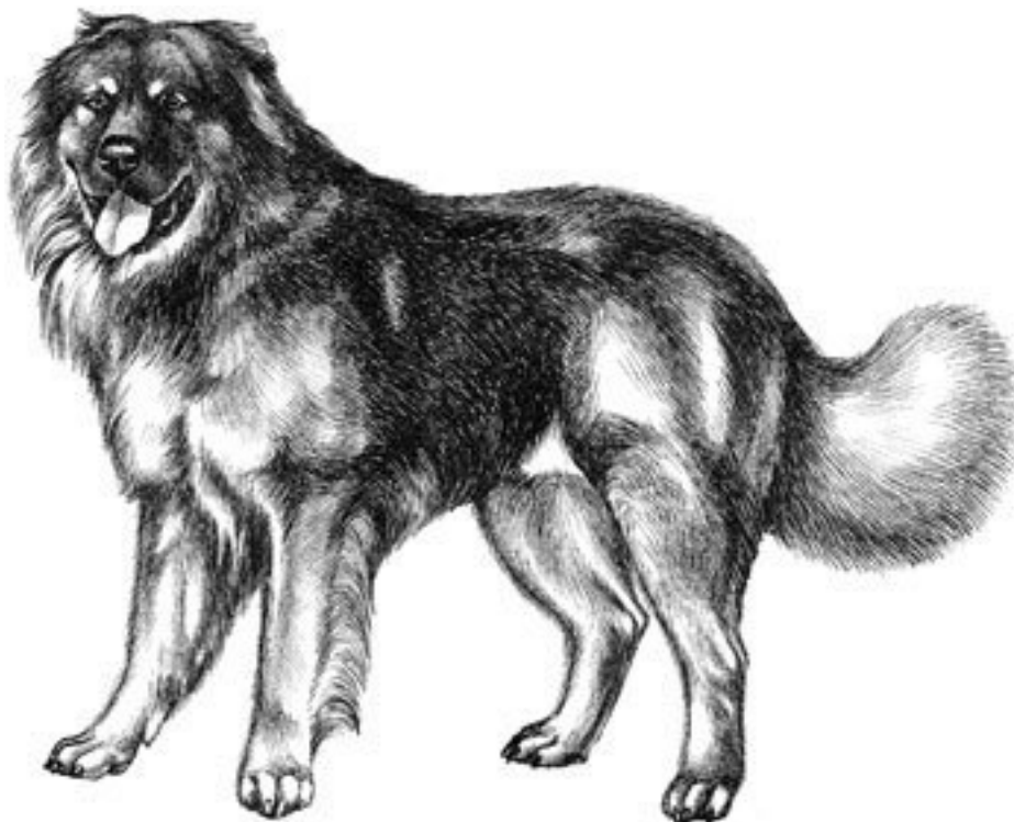
Рис. 3. Кавказская овчарка

Справиться с азиатскими овчарками под силу далеко не каждому, учитывая их физическую силу и суровый характер.