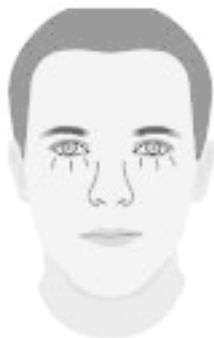
Три морщинки под глазами