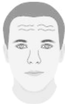
Волнистые, короткие морщины

Тонкие, короткие, волнистые и рассеянные горизонтальные линии на лбу – свидетельство плохого здоровья, безволия. Даже заняв пост, такие люди остаются жесткими, злопамятными.