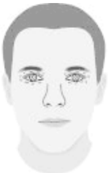
Красные прожилки вокруг век

Люди с небольшими красными линиями вокруг век чаще других попадают в переделки. Но наделяют и способностью их предчувствовать. Также эти линии «невзгод» часто располагаются в большом количестве под уголками глаз или около носа.