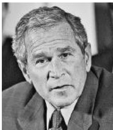
Дугообразные морщины на лбу Джорджа Буша – «следы славы»