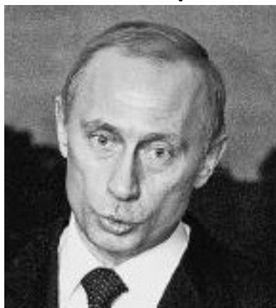
Горизонтальные морщины на лбу Владимира Путина указывают на предприимчивость

Конечно, на каждом участке лица имеется большое количество различных «линий». Но сегодня мы исследуем главные, находящиеся на лбу.