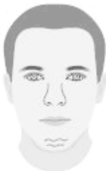
Волнистые линии на подбородке

Тем, у кого есть волнистые линии над кончиком подбородка, следует проявлять повышенную осторожность на воде и быть внимательнее при купании. Об этом же говорят глубокие красные линии на подбородке.