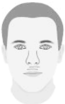
Две морщинки под носом

Людам с двумя горизонтальными линиями, пересекающими желобок под носом, трудно рассчитывать на высокое общественное положение и большой достаток, особенно в пожилом возрасте.