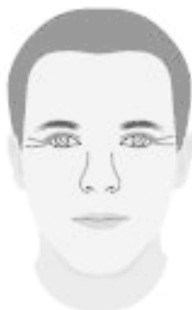
«Рыбьи хвостики» у глаз

Морщины, отходящие от внешнего угла глаза в виде так называемого «рыбьего хвоста» и доходящие до виска, означают хитрый характер и выдают ловкого бизнесмена. Кроме того, такой человек не склонен хранить верность в браке, легко разводится. «Рыбий хвост» указывает и на любвеобильность – частую смену половых партнеров. Если эти «лучики» заметны уже к двадцати годам или если две-три линии загибаются кверху, то это значит, что человек в течение жизни вступит в брак несколько раз.