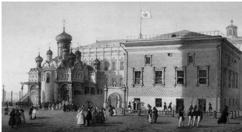
Иллюстрация 1. Грановитая палата (1487–1481, арх. М. Фрязин и П. А. Солари)