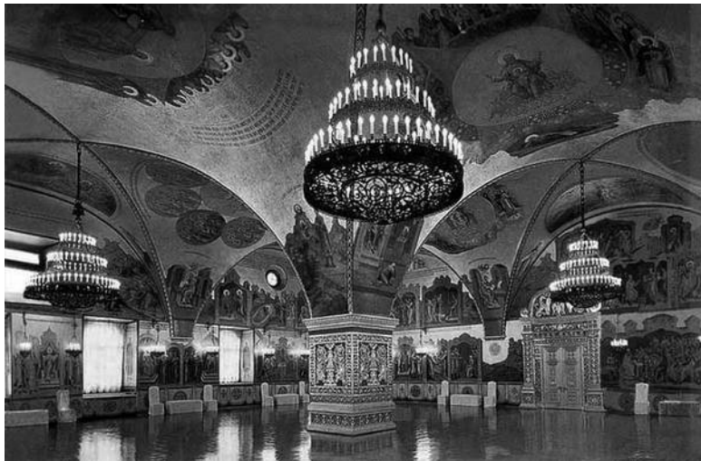
Иллюстрация 2. Главный зал Грановитой палаты с центральным столбом, поддерживающим крестовые своды

Расположенный здесь монарший трон был не столько трон-креслом, сколько (как и в других случаях) особым образом оформленным царским местом, состоявшим из помоста в 3–6 ступеней, трона-кресла и, возможно, балдахина 126 . При