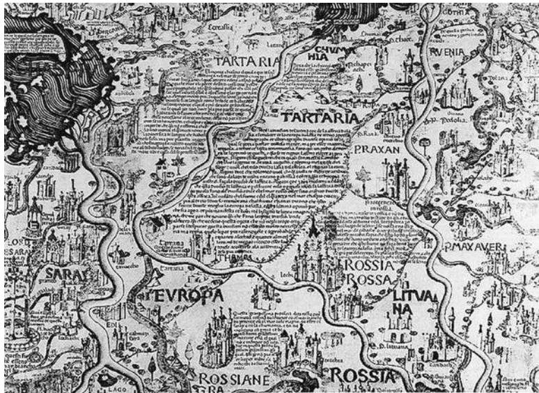
Иллюстрация 1. Фрагмент карты мира (mappa mundi) Фра Мауро. Факсимиле манускрипта глобуса, 1460. Карта диаметром 1,96 м воспроизведена на 48 листах в издании: Il mappamundo di Fra Mauro a Cura di tullia Gasparrini Leporace. Venice, 1956. Fol. 34 (James Ford Bell Libery, University of Minnesota)

Освоение птолемеевской традиции в эпоху Возрождения не было буквальным, а, скорее, происходило на уровне соблюдения форм и номенклатуры понятий. Практически сразу же началась, по выражению Л. Багрова, «диффузия пто-