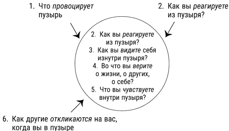
Рис. 2. Пузырь

Это большой прыжок – отпустить старые образцы и приветствовать новое, неизвестное и незнакомое. Наш Раненый Ребенок всегда жил в пузырях и, может быть, никогда не сможет отпустить всех своих произведенных пузырем мыслей и моделей поведения. Легче вести себя, как и всегда – верить, что никто нас не любит, никто не понимает, что мы по самой природе недостойны, что мир – это опасное место и что мы должны позаботиться о себе сами, иначе никто этого не сделает. Но по мере того, как наблюдатель в нас становится сильнее, мы можем видеть эти пузыри как пузыри и наблюдать, как они появляются и исчезают. Мы можем по-прежнему в них входить, но когда мы это делаем, остается видение происходящего, и это само по себе выводит нас из пузырей .