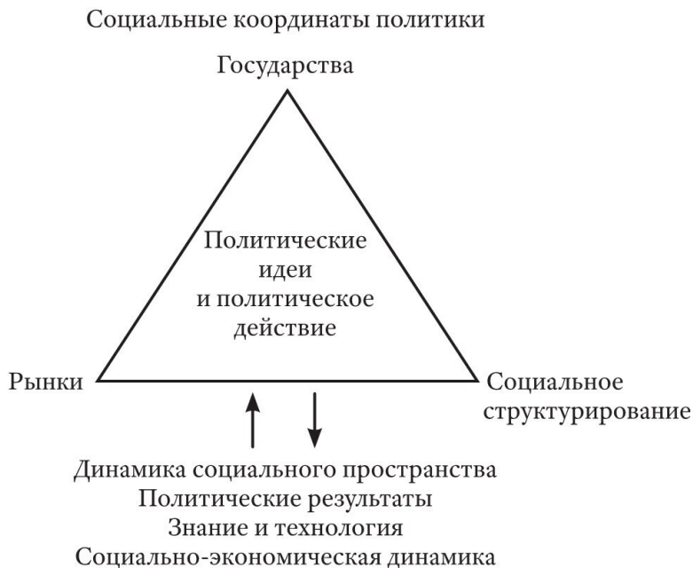
Рис. 1.2. Социальное пространство политики и его динамика

«американскую» бедность, что может считаться по меньшей мере скромным успехом.