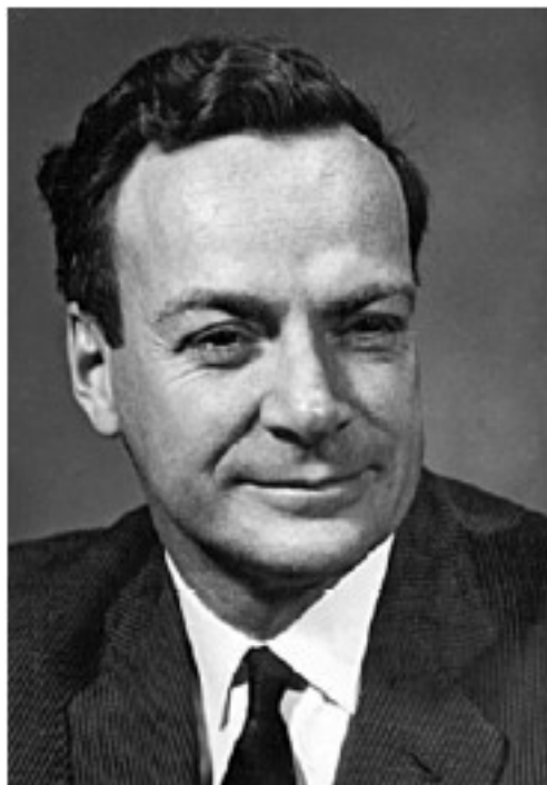
Основоположник нанотехнологии, лауреат Нобелевской премии Ричард Фейнман

Наиболее актуальной оставалась задача разработки и создания инструментального (метрологического) оборудования для изучения атомного строения конструкционных материалов на наноуровне.