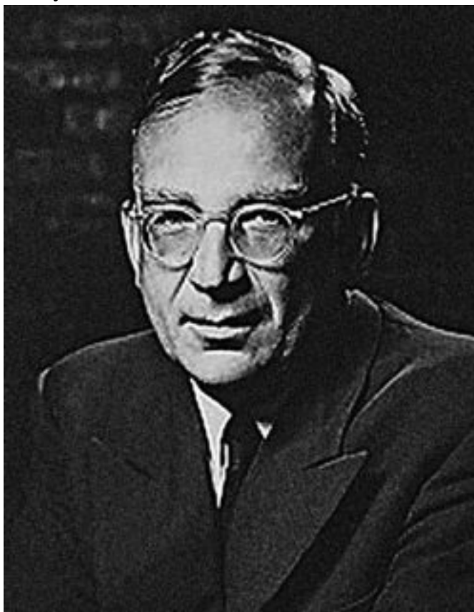
Георгий Антонович Гамов.

На основе установленной им связи между ядерными процессами и космологией Гамов первым предложил модели звезд с термоядерным источником энергии. В 1942 году совместно с Теллером он разработал теорию строения красных гигантов. В 1946–1948 годах ученый предложил теорию получения химических элементов методом последовательного нейтронного захвата и модель «горячей Вселенной» (теорию Большого взрыва), в рамках которой предсказал реликтовое излучение и рассчитал его температуру. Американские астрофизики Арно Аллан Пензиас (Arno Allan Penzias) и Роберт Вудроу Вильсон (Robert Woodrow Wilson), подтвердившие теорию Гамова, в 1978 году стали нобелевскими лауреатами «за открытие микроволнового реликтового излучения».