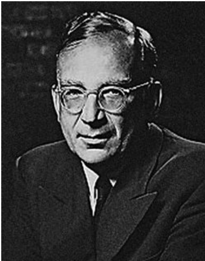
Георгий Антонович Гамов.

В 1954 году Гамов опубликовал статью, где впервые под-