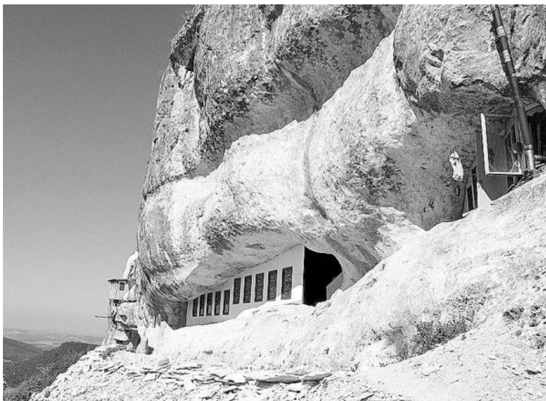
Мангуп-Кале. Пещерный город

Впрочем, это только легенда, раскопки же говорят о том, что культовые сооружения здесь – намного более древние: они остались еще со времен тавров. На окрестных склонах тоже видны остатки древних поселений тавров и руины более поздних, но все-таки отдаленных от нас эпох.