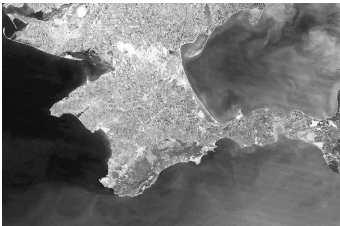
Полуостров Крым. Вид со спутника

Крым – это удивительной красоты полуостров, омываемый Черным и Азовским морями, с невероятно прекрасной природой, с древней и богатой историей.