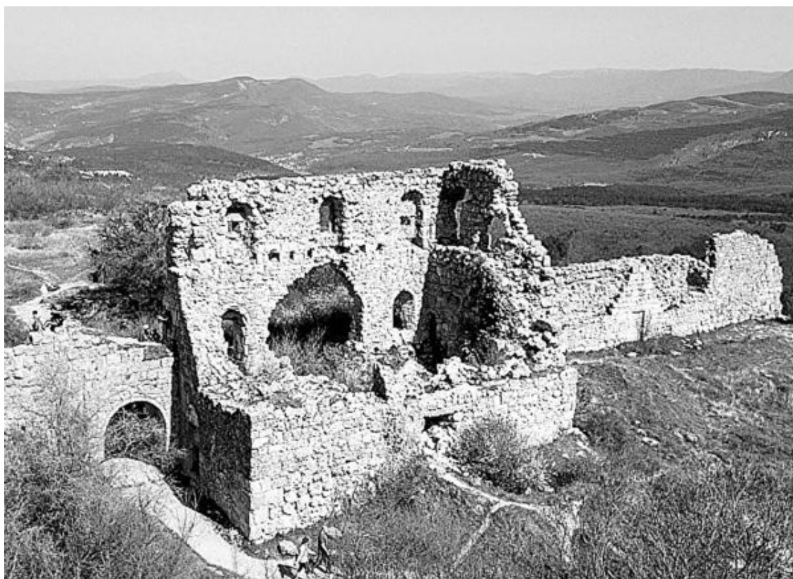
Мангуп-Кале. Остатки царского дворца

Насколько древен этот город – даже и представить трудно: здесь жили еще племена тавров, потом их сменили аланы и сарматы. К X веку Мангуп был уже довольно большим городом, а за мангупских князей не гнушались выходить замуж византийские царевны. В XV веке процветание Мангупа кончилось: город был захвачен и разорен турками. Позже турки отстроили крепость и разместили здесь свой гарнизон, но после присоединения Крыма к России они ушли из Мангупа. Город заселили караимы – но потом ушли и они. Долгое время Мангуп был заброшен и разрушался.