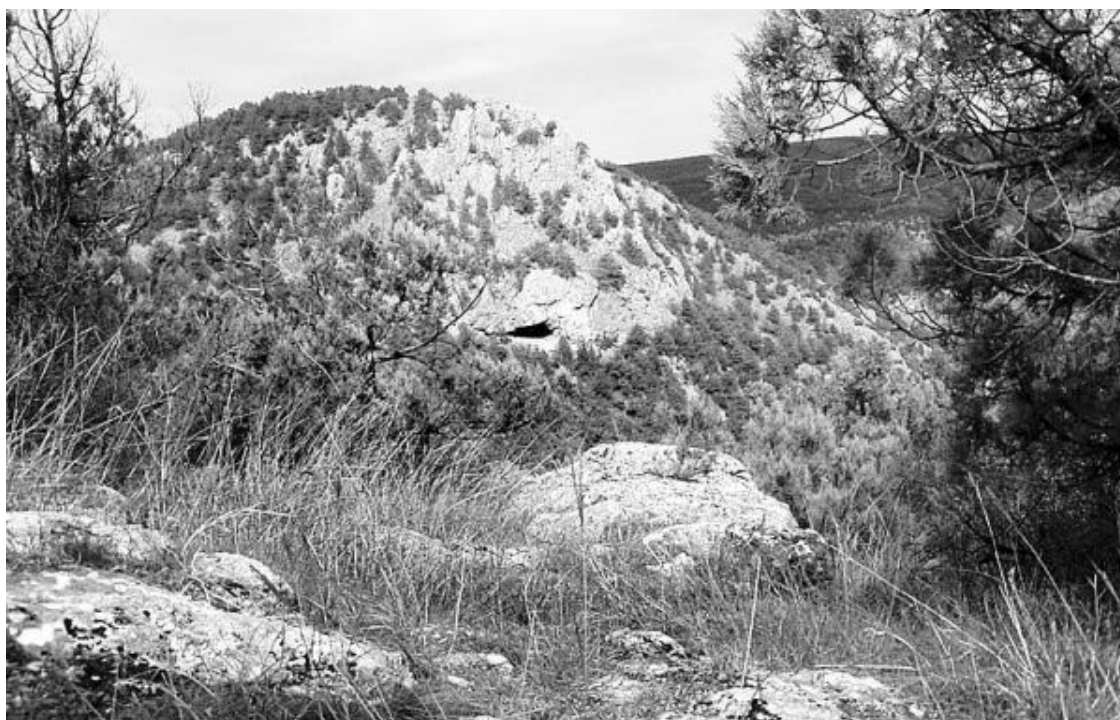
Грот Мурзак Коба

Этой юной особе многое пришлось испытать в своей недолгой жизни: еще в подростковом возрасте ей ампутировали кончики обоих мизинцев. Что это был за ритуал, можно только предполагать: то ли знак некоего социального статуса, то ли инициация, то ли наказание.