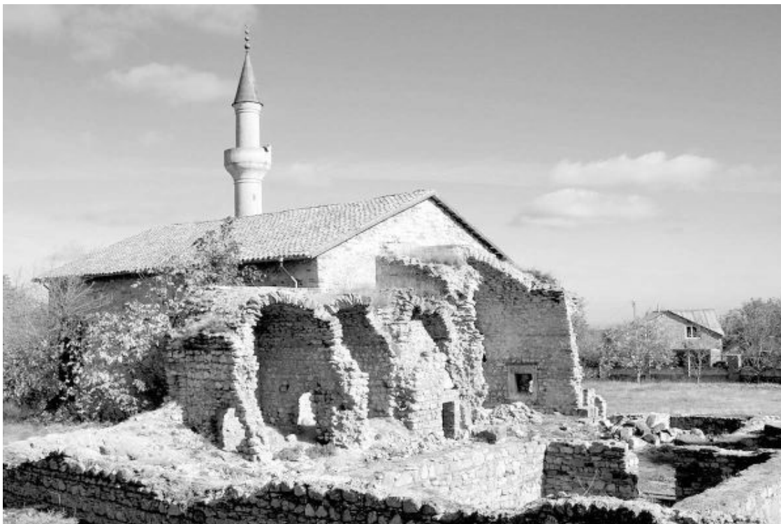
Мечеть хана Узбека

В 1314 году ханом Узбеком в Кырыме была построена мечеть, а рядом медресе – мусульманская высшая школа. Причем, как показали раскопки, в медресе был даже проведен водопровод.