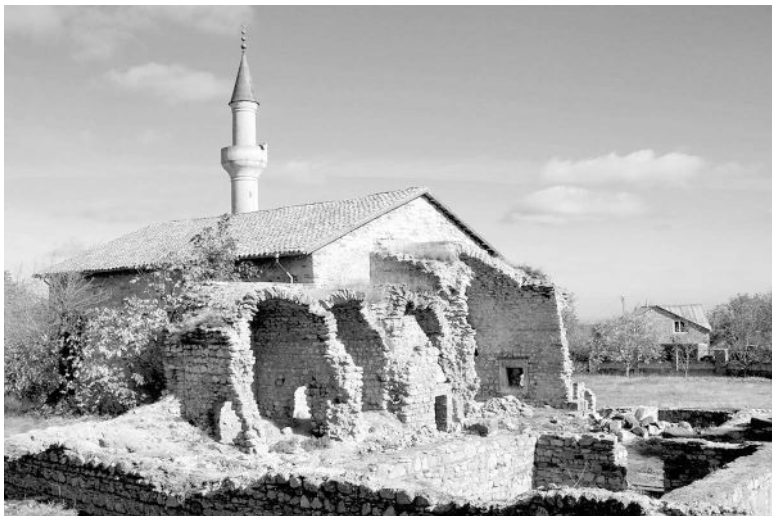
Мечеть хана Узбека

В 1314 году ханом Узбеком в Кырыме была построена мечеть, а рядом медресе – мусульманская высшая школа. Причем, как показали раскопки, в медресе был даже проведен водопровод.