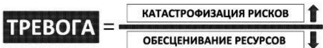
Рис. 2. Краткая формула тревоги

Таким образом, во время эпизодов тревоги человек избыточно концентрируется на мыслях об опасности и своей неспособности справиться с тревожащей ситуацией, что приводит к невозможности более трезвого рассмотрения менее угрожающих вариантов развития событий, поскольку в моменты выраженной тревоги довольно сложно мыслить рационально. Иными словами, человек начинает тревожиться, когда риски трактуются как высокие, а он не осознаёт, за счёт чего и как можно с ними совладать (рис. 2).