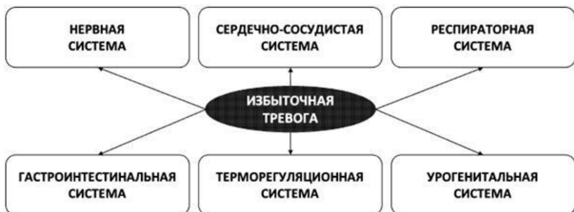
Рис. 5. Многогранность телесных проявлений тревоги

Необходимо понимать, что симптомы, вызванные избыточной тревогой, какими бы неприятными они ни были, являются не признаком реального органического заболевания, а следствием искажённого мышления, которое создаёт тревогу, не могущую проявляться иначе, как в виде телесных симптомов. А симптоматики, порождаемой избыточным уровнем тревоги, может быть превеликое множество, поскольку тревога заставляет активно работать разные органы и системы человеческого организма (рис. 5).