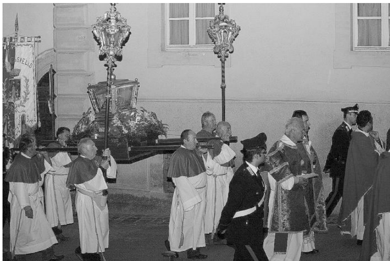
Ларец с мощами в день святого покровителя Спелло