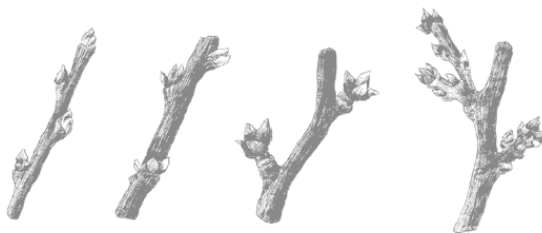
Рис. 1. Образование приростов на ветках сливы

Молодые побеги голые или войлочно-опушенные, красно-коричневые или зеленовато-желтые, угловатые; старые ветви и стволы с темно-буро-серой растрескивающейся корой. Листья эллиптические или обратнояйцевидные, 4-10 см в длину и 2,5–5 см в ширину, с городчато-пильчатым краем, сверху голые и темно-зеленые, снизу опушенные и светло- или серозеленые; светло-желтые осенью. Цветки до 2,5 см в диаметре, в пучках по 2, реже по 1–5. Лепестки белые (иногда с зеленым оттенком). Плоды – костянки (рис. 2) – от мелких (6-10 г) до крупных (50–70 г), длиной 2–7 см, шириной 2–4 см, разнообразной формы: от приплюснутото-округлых до удлинненно эллипсоидальных, с боковой бороздкой, фиолетовые, желтые, бледно-зеленые, зеленые, красные, часто с сине-серым восковым налетом. Мякоть плодов чаще желтая или зеленоватая, довольно плотная, сочная, кисло-сладкая.