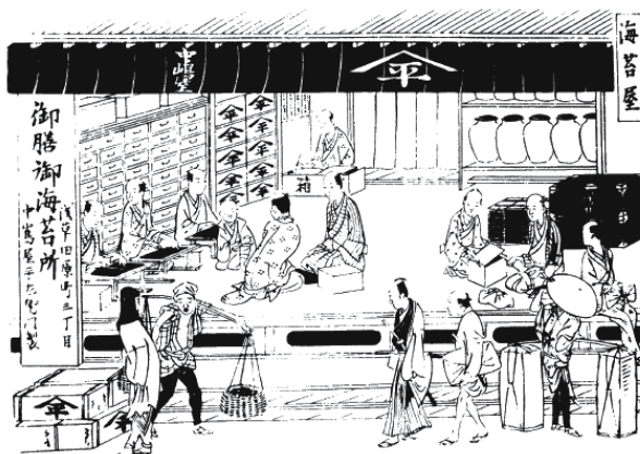
Рис. 1. Самурай на улице. Самурай, носящий два меча, в сопровождении слуги с ношей, завернутой в традиционный шелковый платок (фуросики), идет мимо лавки, торгующей водорослями. Мужчины слева режут сушеные водоросли, которые в Японии едят с рисом. Над входом – норэн (ткань, защищавшая помещение от пыли и служившая символом независимости предприятия) с надписью «Накадзима-я». Старший продавец вносит записи в бухгалтерскую книгу.

Принадлежность к этому сословию наследовалась, и оно включало многих, чьи предки в давние времена были крестьянами, готовыми взяться за оружие, чтобы сражаться в местных армиях. Другие принадлежали к кланам, владеющим большими поместьями в областях, далеких от столицы, будучи их прямыми потомками или людьми, занявшими место прежних землевладельцев при императоре, когда он еще реально правил Японией. Некоторые семьи самураев изначально были тесно связаны с императором, который, отягощенный финансовым бременем слишком многочисленных потомков, в X веке понизил некоторые группы своих иждивенцев до положения обычной знати, наделив их землей и, таким образом, освободив себя от дальнейших обязательств. Одной из этих групп был клан Минамото, расширивший свои землевладения грабительством и возвысившийся до правителей Японии в XIX веке, семейство же Токугава, которое долго владело небольшим имением в провинции Микава, к востоку от Нагои, прежде чем переехать в Эдо, утверждало, что является потомком этих древних сёгунов.