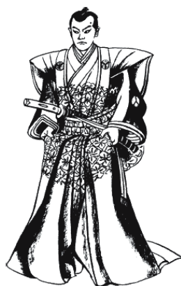
Рис. 3. Самурай в нагабакама

Пока у них был какой-то доход, они могли позволить себе удобное жилище; когда дела шли хуже, им приходилось в лучшем случае жить в храмах, в худшем – в любом убежище, какое возможно было найти.