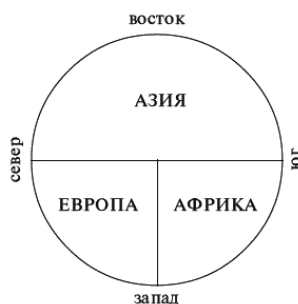
Рис. 1. «Т» в «О»; традиционное изображение картины мира («маппамунди»)

Новый мир открывался, потому что закрылся старый. Не было иного пути на Восток, кроме как вдоль африканского побережья. Моряк, который теперь пускался в это плавание, сознавал, что судьба бросает ему великий вызов и открывает большие возможности. Перед ним лежали бескрайние серые просторы Атлантики, за горизонтом которых могло оказаться все, что угодно. Но прежде чем воспользоваться этой возможностью, требовалось приобрести три вещи: карты, навигационные инструменты и корабли. Все это появилось к концу XV столетия.