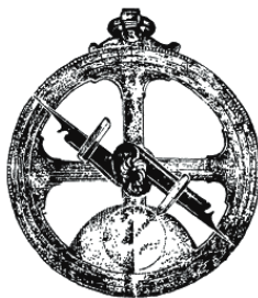
Рис. 5. Астролябия

Астролябия дала возможность преодолеть эту трудность. Астрономический вариант этого прибора являлся устройством красивым и сложным, с его помощью отмечали движение планет. Астролябия моряков была просто металлическим кольцом – кстати, ее часто называли «моряцкое кольцо», – размеченным на градусы, с металлической же подвижной планкой, проходящей через центр круга (см. рис. 5).