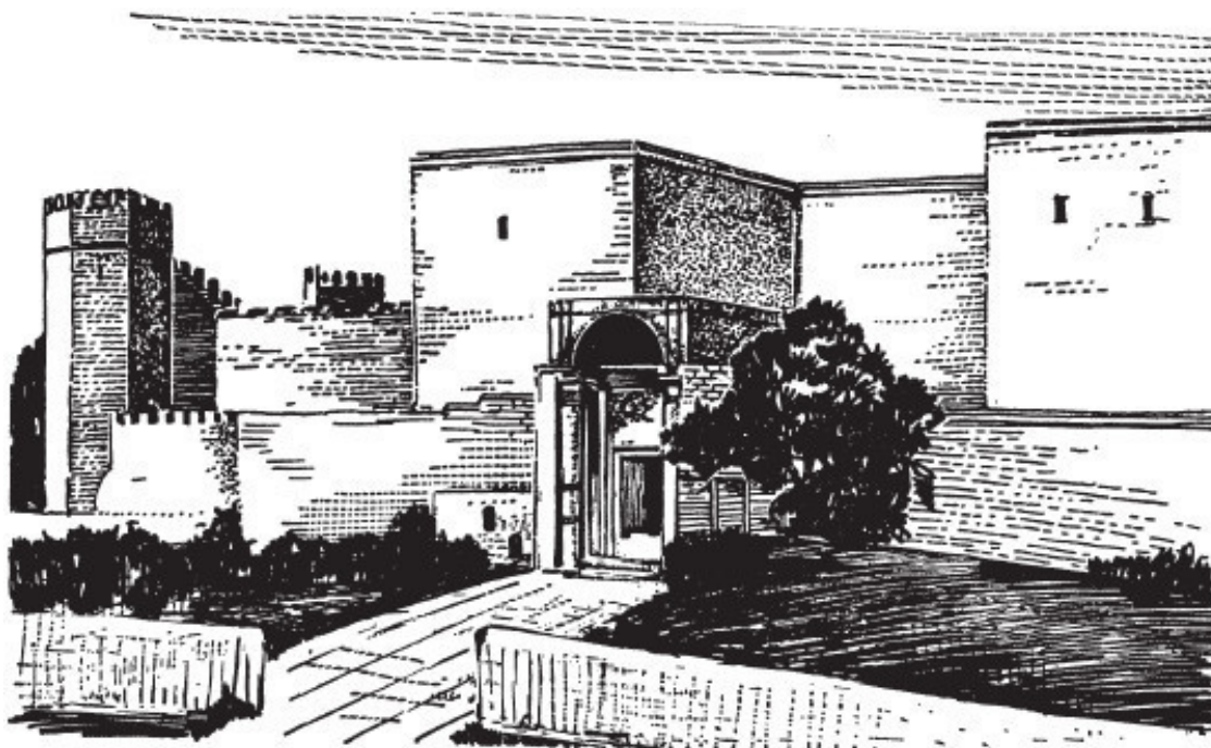
Рис. 4. Золотые ворота и часть земляного вала Константинополя

Как правило, оно состояло из гиматона или плаща, надеваемого поверх хитона или рубахи. Редко эти облачения сохраняли изначальный белый цвет. Поскольку этим людям было суждено вечно вкушать блаженство в раю, их одежды были окрашены во все цвета радуги. Зачастую они украшались золотом, как индийские сари. На белых одеждах складки выписывались с помощью многочисленных оттенков.