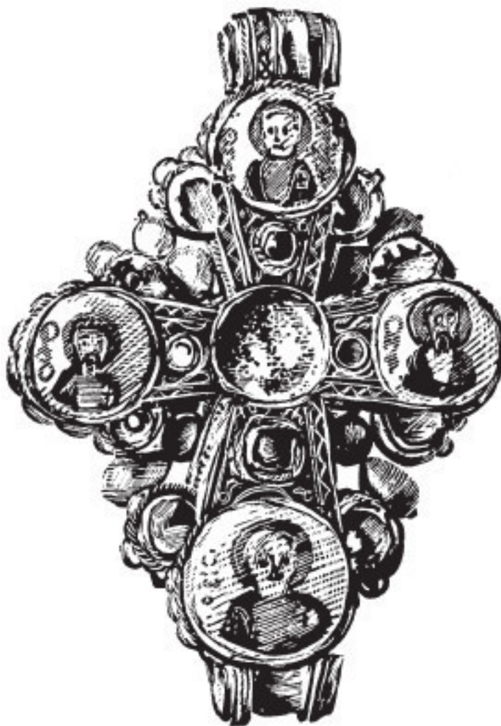
Рис. 5. Крест. IX в.

Но убедительная победа над арабами в 678 году, одержанная в значительной степени благодаря использованию «греческого огня», спасла не только столицу империи, но и большую часть Малой Азии. Это было временное достижение, поскольку с конца VII века византийцам пришлось сосредоточиться на усмирении захватнических амбиций соседей-славян. Сначала им пришлось признать независимость Болгарского государства, затем Руси и Сербии. Начиная с XI века Византия испытывала постоянную угрозу со стороны турок-сельджуков. Также подрывали ее могущество и Крестовые походы на западе, отнимая у нее столько сил, что в конце концов империя не смогла противостоять нашествию турок-османов. В 1453 году, когда Византия едва простиралась за пределы Константинополя, турки нанесли последний удар. Под прикрытием пушечного огня они разрушили стены города. Последний оплот Византии пал, когда большая часть населения погибла вместе с императором на укреплениях, которые они защищали, проявляя величайший героизм. По традиции турков покоренный город передавался на три дня солдатам-победителям для разграбления и разрушения. Многие греки из тех, кто пережил осаду, были убиты в это время. Некоторые спасшиеся потом согласились пойти на службу в турецкое казначейство или были назначены на посты правителей завоеванных провинций, например Армении. Эти люди снискали презрение прочих константинопольских христиан и получили от соотечественников прозвище «фанариоты». Турки заставили непокорных запла-