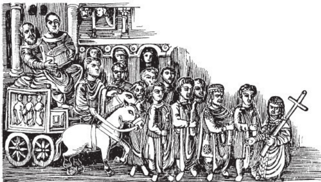
Рис. 7. Императрица во главе процессии во славу священной реликвии

нили в соборе. Император использовал ее только для некоторых особенных случаев. Достигнув серебряных врат, он зажигал свечи, предназначенные только для него, и переходил к порфирной плите, вмонтированной в пол напротив царских врат иконостаса (стенка перед алтарем, сооруженная для размещения икон), для молитвы.