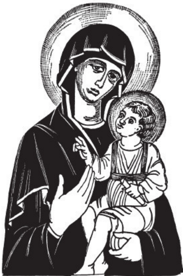
Рис. 2. Икона «Богоматерь Одигитрия»

при том присутствовали, – знак в небе и услышал голос, повелевший его воинам нарисовать сей знак на своих щитах перед битвой. Но Константин усомнился в том, что действительно видел то знамение. Однако вскоре, согласно Евсевию, ему явился Христос, повелевший изобразить этот символ на личном знамени Константина, с которым он поведет свое войско в бой. В этом видении Константин узрел солнце, символ Аполлона, который был принят римскими кесарями и, таким образом, являвшийся по праву эмблемой Константина. Огромный штандарт с изображением солнечных лучей был щедро украшен золотом и имел поперечину наверху, к которой крепились две узкие пурпурные ленты, расшитые золотом и усыпанные драгоценными камнями. Увенчан он был золотым венком с золотым крестом и греческими буквами, монограммой Христа, а также, согласно некоторым источникам, словами « hōc vīnces » 1 . Пурпурные ленты, как лучи солнца, указывали на принадлежность Константину, потому что пурпурные одеяния – самая дорогая и редкая из всех тканей, поскольку краску можно было добыть только из достаточно редкого моллюска мурекс – по распоряжению Диоклетиана использовались только правящим семейством.