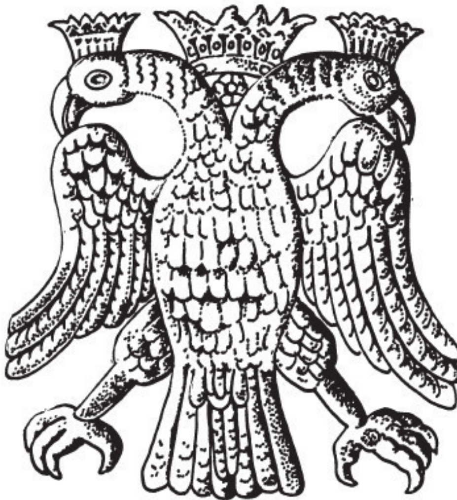
Рис. 8. Двуглавый орел Византии