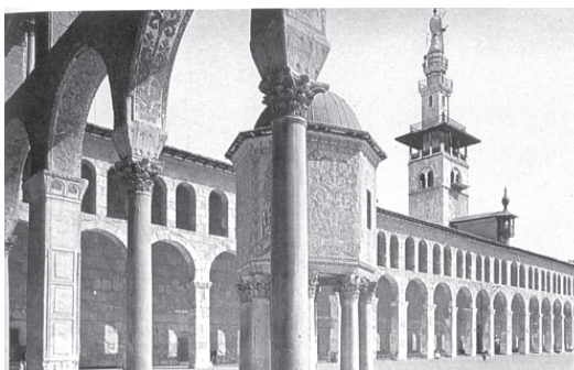
Мечеть Омейядов в Дамаске

Переходя к рассказу о ситуации, сложившейся в исламском мире в XI веке, то есть в эпоху, непосредственно предшествующую крестовым походам, стоит еще раз сказать, что и, казалось бы, непримиримые религиозные разногласия, и политическая раздробленность, по большому счету, не поколебали его глубинного внутреннего единства. Это шло еще от заветов Мухаммеда, от первой мусульманской общины – уммы, от признания всеми мусульманами святости Корана. Духовный раскол не мешал шиитам и суннитам быть добрыми соседями в исламских городах; персидские радикалы-исмаилиты скорее считали себя единым народом с суннитами-ортодоксами Средней Азии или Испании, чем с говорящими с ними на одном языке и живущими рядом персами-зороастрийцами 15 . Ислам был един и непримирим по отношению к язычеству. Несколько иным, более мягким, было отношение к «людям писания» – христианам и иудеям – которых в то время считали просто заблудшими, но не потерянными для истинной веры детьми. Это своеобразие мусульманского мировоззрения сыграло немалую роль как накануне, так и во время крестовых походов. Но об этом речь еще впереди.