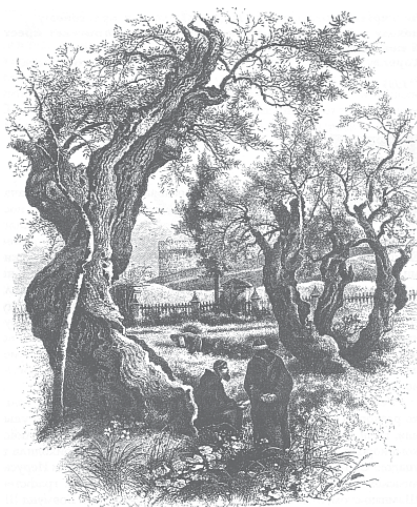
Гетсиманский сад в Иерусалиме. Гравюра Г. Доре

В 1073 году Гильдебранд, долгие годы руководивший действиями апостольского престола из-за спины своих ставленников, решил, что, наконец, пришло его время. При огромной поддержке римского народа (кто мог знать тогда, что через десять с небольшим лет она обратится в столь же всенародную ненависть?), Гильдебранд избирается новым папой и принимает имя Григория VII. Имя это ко многому обязывает: ведь первым папой, носившим его, был Григорий Великий, доктор церкви, давно причисленный к лику святых и в известности соперничающий с крупнейшими христианскими деятелями всех времен. И бывший монах не посрамил своего нового имени – его понтификат 10 остался в истории как один из наиболее ярких.