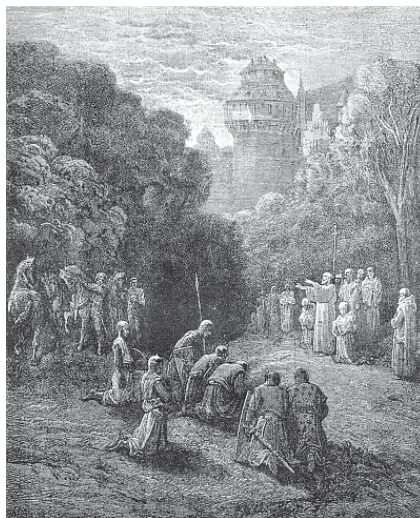
Благословение. Гравюра Г. Доре

римской аристократии и итальянских магнатов. С этого времени папская тиара быстро переходила от одного папы к другому, смотря по тому, какая из аристократических клик оказывалась на данный момент сильнее. Достаточно сказать, что от Марина I до Марина II с 882 до 942 гг., то есть всего за шестьдесят лет на папском престоле попеременно восседало целых двадцать первосвященников – уникальный случай в долгой истории папства. И многие из этих «наместников Христа на земле» покинули грешную земную юдоль не без помощи некоторых особо заинтересованных сторон.