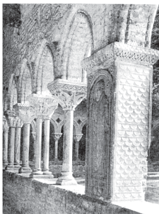
Аббатство Муассак, которое посетил Урбан II перед клермонской речью