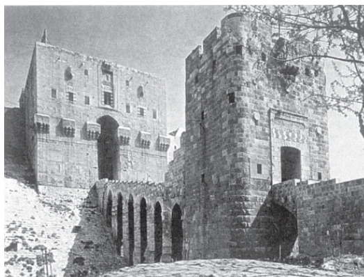
Цитадель Халеба (Аленпо)

Вскоре Мухаммед вынужден был бежать от преследований Мусы и суннитского халифа. Его дальнейшая судьба скрыта туманом, но известно, что он оставил после себя нескольких сыновей. Следы этих сыновей затерялись в истории, но не в людской памяти. И через несколько столетий среди исмаилитов то тут, то там появлялись очередные потомки Исмаила, объявлявшие себя имамами. Но большая часть исмаилитов верила в то, что очередной имам скрыт, и останется скрытым до конца веков, когда восстанет во славе и низвергнет всех своих противников. А группировка карматов, одна из самых радикальных в исламе, основываясь на священности числа «семь», вообще считала Мухаммеда-бен-Исмаила последним имамом и ожидала теперь явления седьмого пророка 14 , которого называли «махди» («спаситель, мессия»). От карматов вера в Махди перешла и во многие другие религиозные движения, а позже, в эпоху крестовых походов, махдизм сыграл немалую роль в исламском джихаде против крестоносцев.