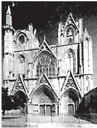
Собор в Фамазусте. Кипр

Придя в монастырь, неофит 6 отрекается от мира, отвергает его искушения и богатства, ворота обители навсегда закрываются за ним, отрезая от прошлой жизни. Но, между прочим, отказываясь от богатства, поступающий в монахи должен был внести в кассу монастыря очень серьезный денежный взнос. Впоследствии, именно эта система крупных взносов во многом нарушила первоначальные планы основоположников монашества: располагая огромными денежными средствами, бенедиктинские монастыри начали покупать земли и крестьян; физический труд, который св. Бенедикт считал для монахов обязательным, был переложен на плечи мирских работников, а монашество все больше погрязало в праздности. Настоятели монастырей понемногу начали превращаться в таких же феодалов, как владельцы соседних замков; таким образом, всеобщее обмирщение коснулось в X веке и монастырских стен.