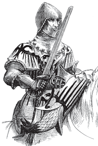
Конный рыцарь с мечом

или слуг. Жесткие турнирные принципы – проигравший выбывает – одновременно работали и на качественное улучшение рыцарского сословия. Более сильные воины приобретали здесь и дополнительный боевой опыт и, часто, лучшее вооружение; потерпевшие поражение нередко покидали ряды рыцарства, освобождая дорогу более умелым и сильным. Этакая теория естественного отбора, с блеском применяемая на практике.