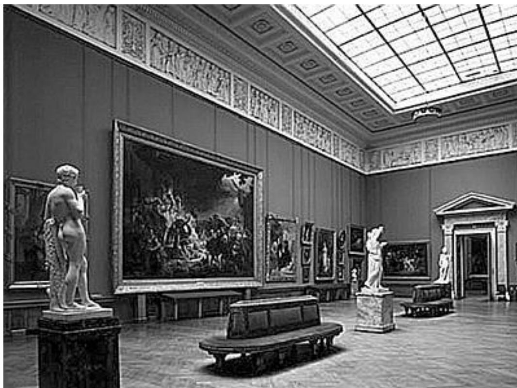
Зал Русского музея

В настоящее время коллекция Русского музея насчитывает около 400 000 экспонатов и охватывает все исторические периоды и тенденции развития русского искусства, его основные виды и жанры, направления и школы более чем за 1000 лет: с X по XXI в.