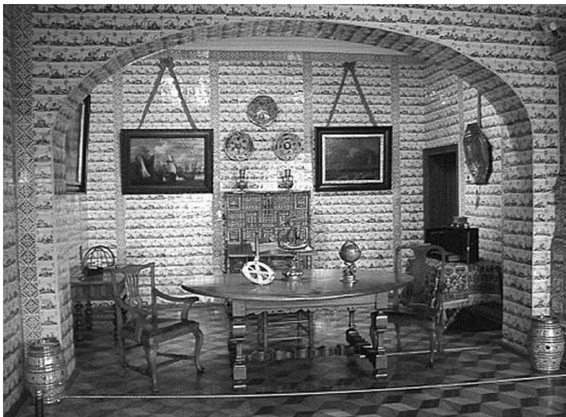
Дворец Меншикова. Интерьер

После того как Меншиков при Петре II попал в опалу и отправился в ссылку в Березов, дворец частично перестроили по проекту М.Г. Земцова для размещения в нем Сухопутного шляхетского корпуса. Первоначальный облик дворца восстановлен в ходе реставрационных работ, начатых в 1960-х гг. В 1981 г. дворец-музей открылся для посетителей.