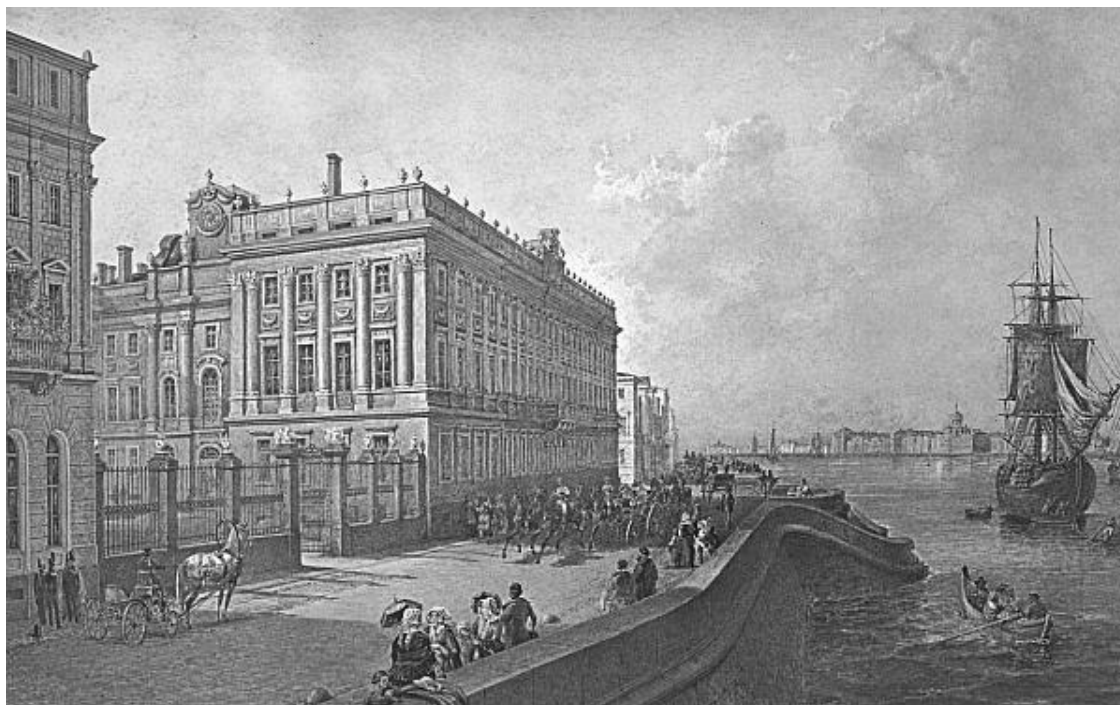
В.С. Садовников. Мраморный дворец. 1847 г.

После смерти Григория Орлова Екатерина II выкупила дворец у наследников и в 1796 г. подарила своему внуку, великому князю Константину Павловичу, по случаю его бракосочетания с принцессой Саксен-Заальфельд-Кобургской Юлианой-Генриеттой-Ульрикой.