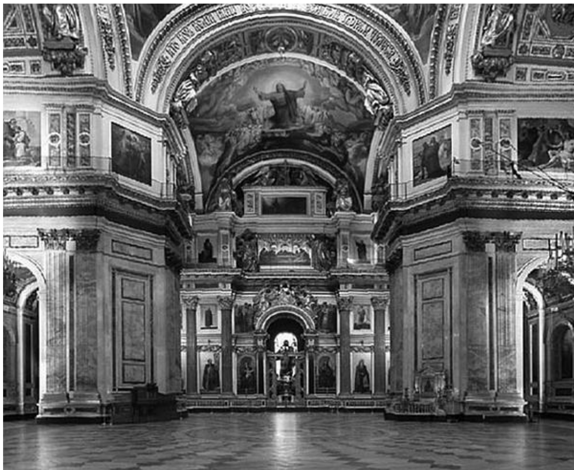
Исаакиевский собор. Интерьер

Послевоенная экспозиция Исаакиевского собора включала следующие разделы: «Исаакиевский собор как историко-художественный и архитектурный памятник»; «История постройки Исаакиевского собора»; «От собора к музею»; «Маятник Фуко».