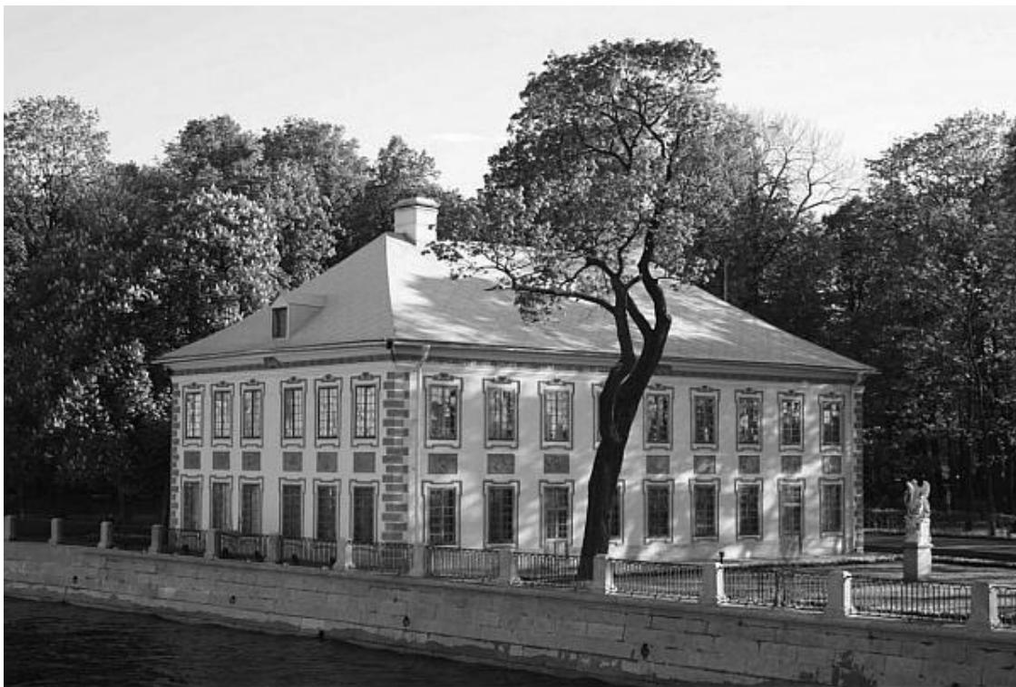
Летний дворец Петра I

гории «Слава», «Архитектура», «Мореплавание», «Истина», «Искренность», статуи греческих и римских богов: встречают посетителей «Минерва», «Флора», «Церера», «Вертумн», «Помона». Украшали сад и скульптурные группы работы венецианского скульптора Пьетро Баратта «Мир и изобилие» и «Ништадтский мир». Однако звездой всей коллекции, несомненно, являлась статуя Венеры Таврической, полученная Петром I от Папы Римского в обмен на мощи Святой Бригитты, захваченные при осаде Ревеля. Статуя стояла в одной из мраморных галерей. Позже ее перенесли в Эрмитаж.