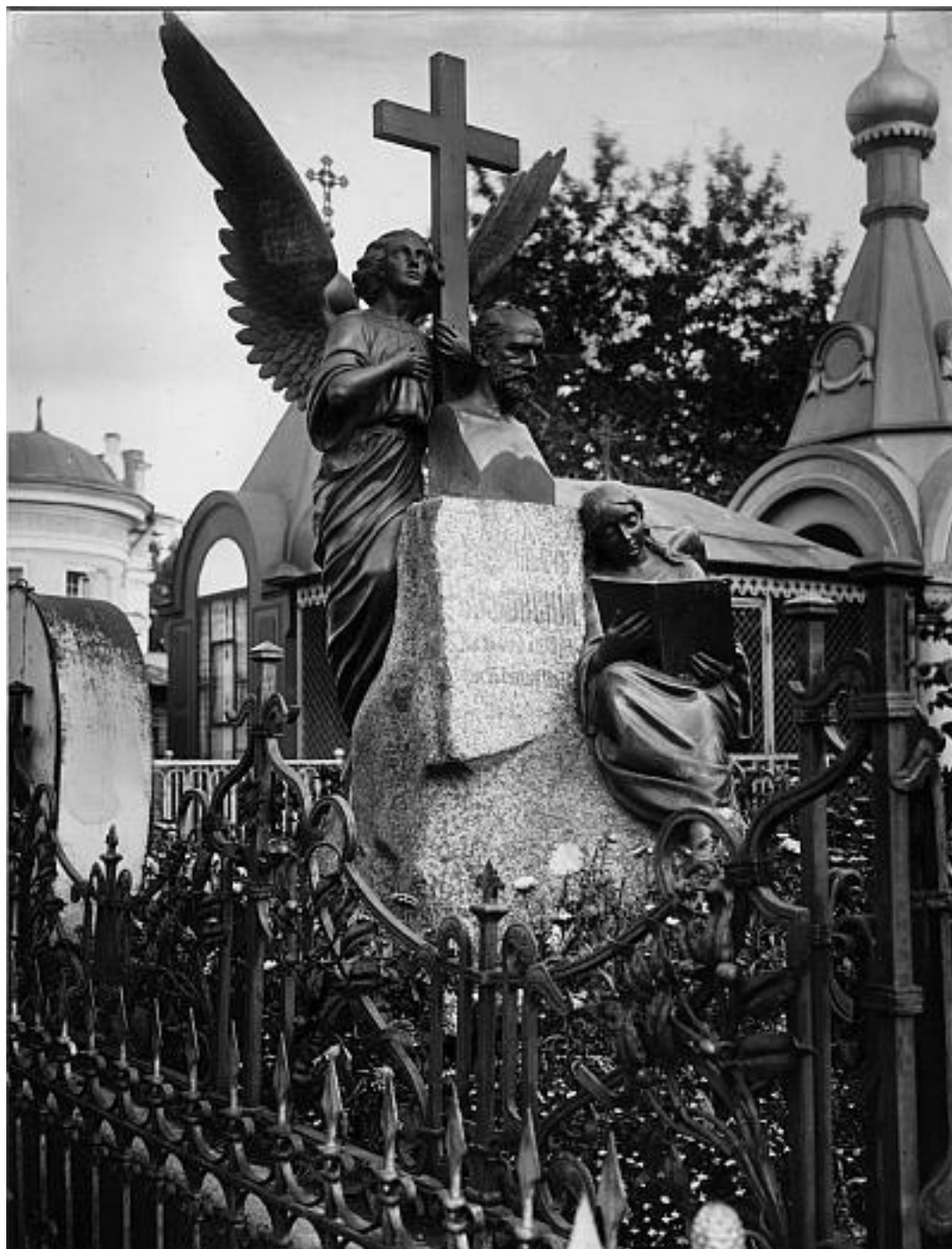
Надгробие П.И. Чайковского на Тихвинском кладбище

петербургских зодчих: И.Е. Старова, А.Н. Воронихина, А.Д. Захарова, Ж. Тома де Томона, Д. Кваренги, К.И. Росси, А. Бетанкура.