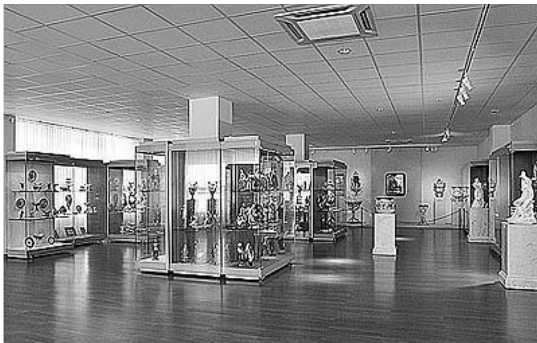
Фрагмент экспозиции музея Императорского фарфорового завода

Управление заводом князем Б. Юсуповым, большим знатоком и ценителем искусства, во многом способствовало развитию художественного направления в изготовлении фарфора. Период управления князем Б. Юсуповым стал блистательной вершиной в деятельности Императорского завода.