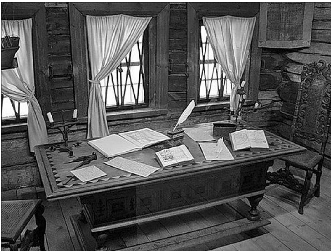
Домик Петра I. Кабинет

С 1930 г. в Домике размещается историко-мемориальный музей.