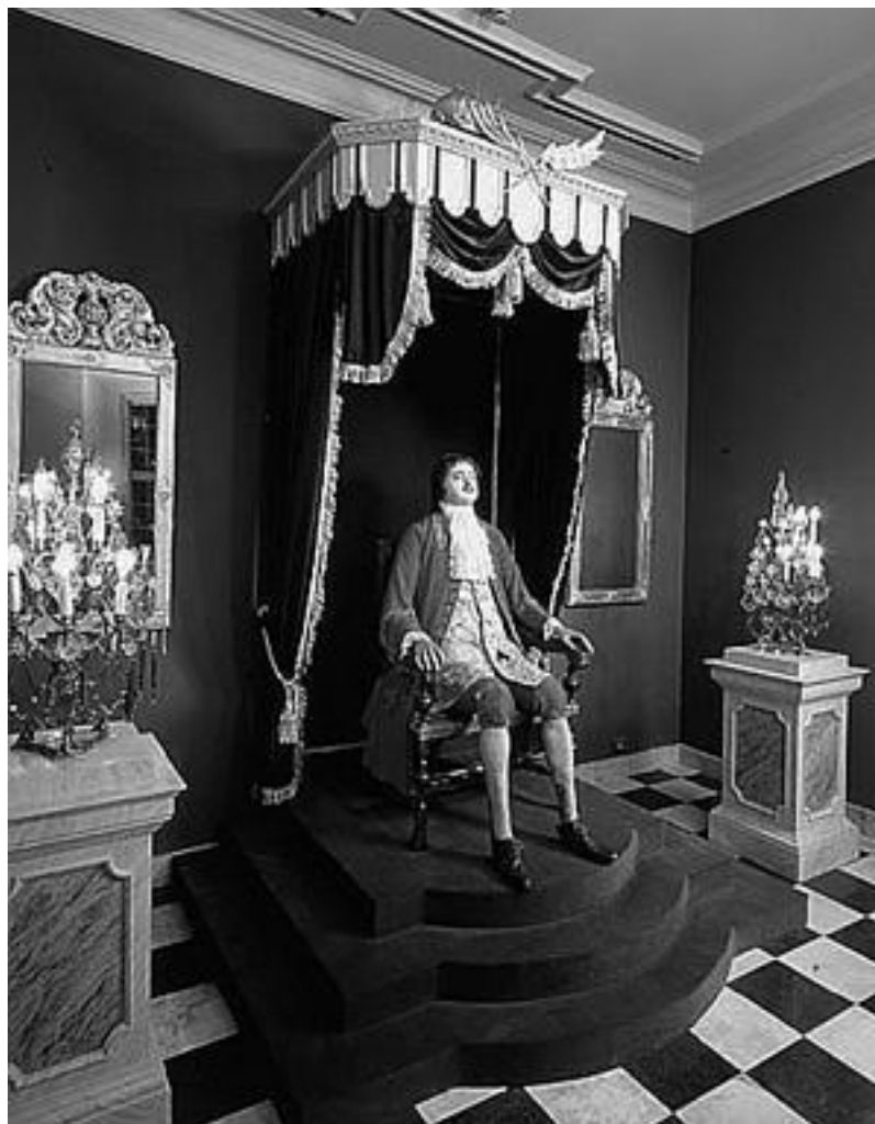
Зимний дворец Петра I. Фрагмент экспозиции