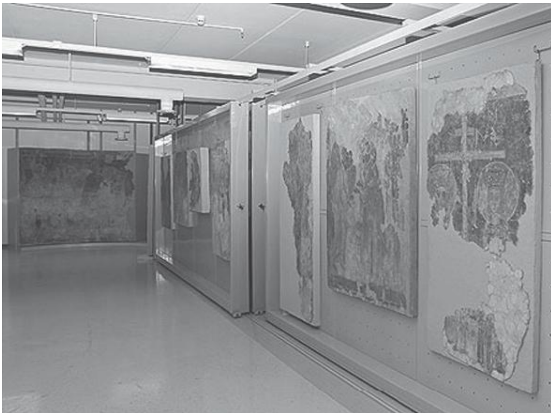
Фрагмент экспозиции Реставрационно-хранительского центра «Старая деревня»

Это самое новое здание, входящее в Эрмитажный комплекс, его торжественное открытие состоялось 16 мая 2003 г. и было приурочено к 300-летию Санкт-Петербурга. В проекте использовались современные подходы к организации хранения (в том числе по формированию климата), реставрации, информационному обеспечению, а также учтены последние достижения в области системы безопасности.