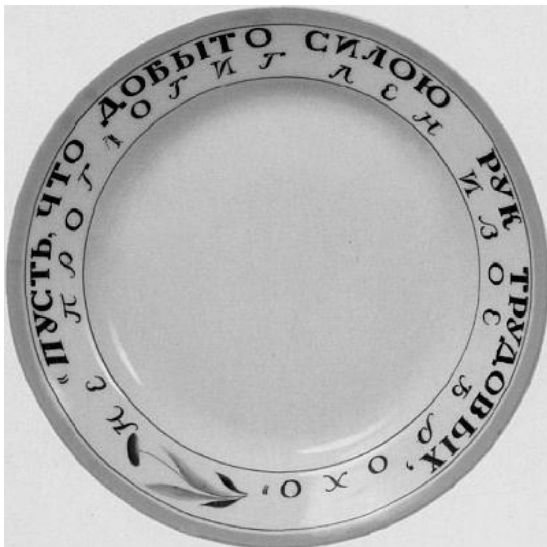
С. Чехонин. Тарелка. 1919 г.