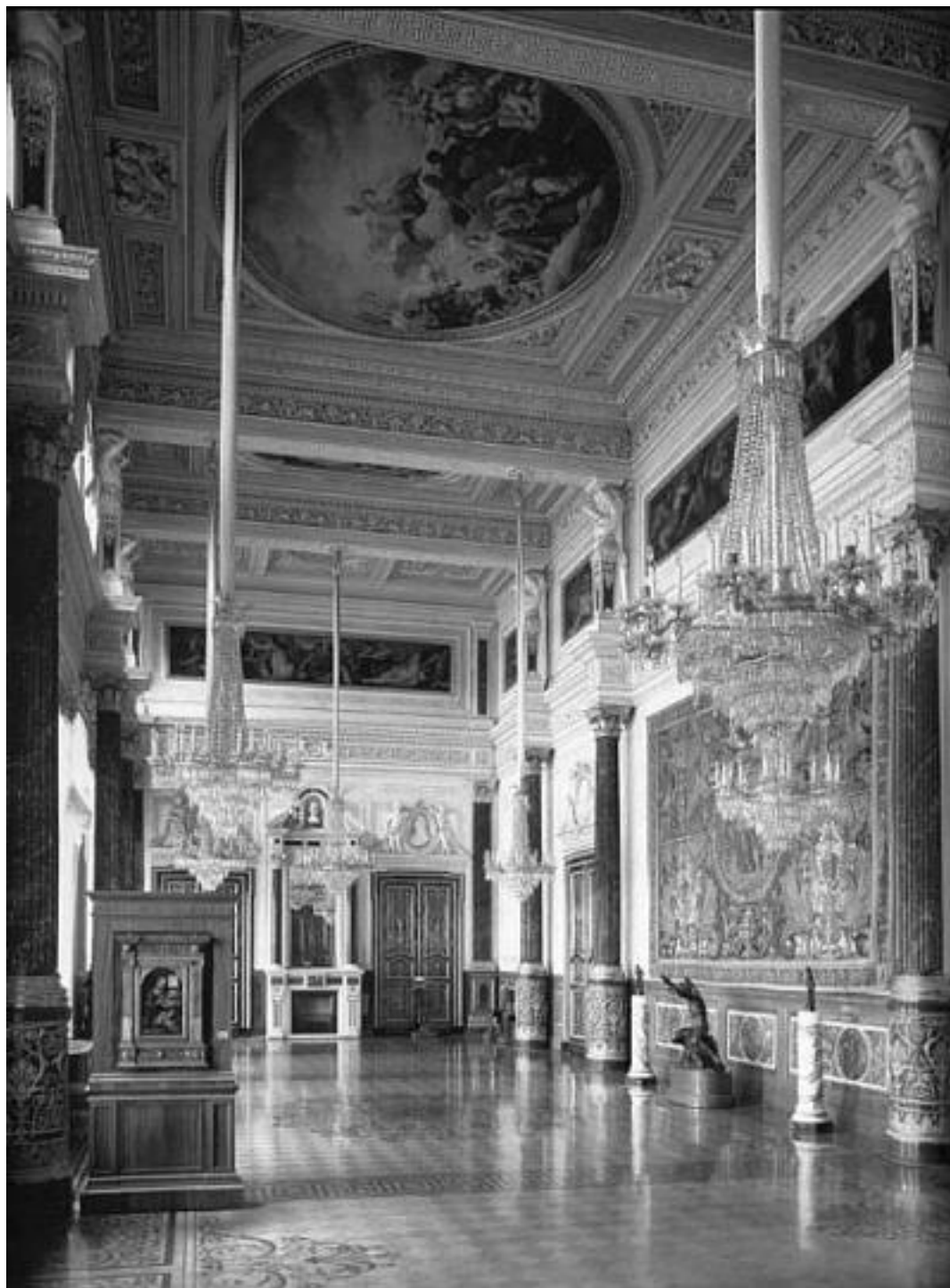
Зал Леонардо да Винчи

На первом этаже Главного комплекса находятся археологические коллекции, в том числе – экспозиция античной скульптуры. Большой интерес традиционно вызывает Галерея драгоценностей, ее основу составила ювелирная коллекция русской Императорской фамилии. Галерея включает в себя «Золотую кладовую», в которой представлены произведения древнегреческих мастеров, золото скифов, драгоценности стран Востока: Индии, Ирана, Китая, и «Бриллиантовую кладовую», где можно увидеть древние золотые изделия, шедевры ювелирного искусства мастеров Западной Европы и России, драгоценности из коллекций членов императорской семьи Романовых и частных собраний Петербурга, памятники церковного искусства, дипломатические подарки русскому Двору, изделия фирмы Фаберже.